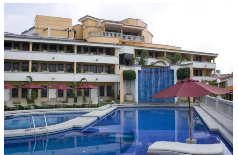
Hoteleros de Morelos aseguraron que los hechos delictivos que se han registrado en el estado sí influyeron en la llegada de turistas para estas vacaciones, ya que no ha repuntado la ocupación hotelera durante este periodo.

HASTA ESTE VIERNES 16 de agosto, sumaban en Morelos 16 defunciones asociadas al dengue y dos mil 904 casos confirmados. En una semana aumentaron 423 nuevos casos.