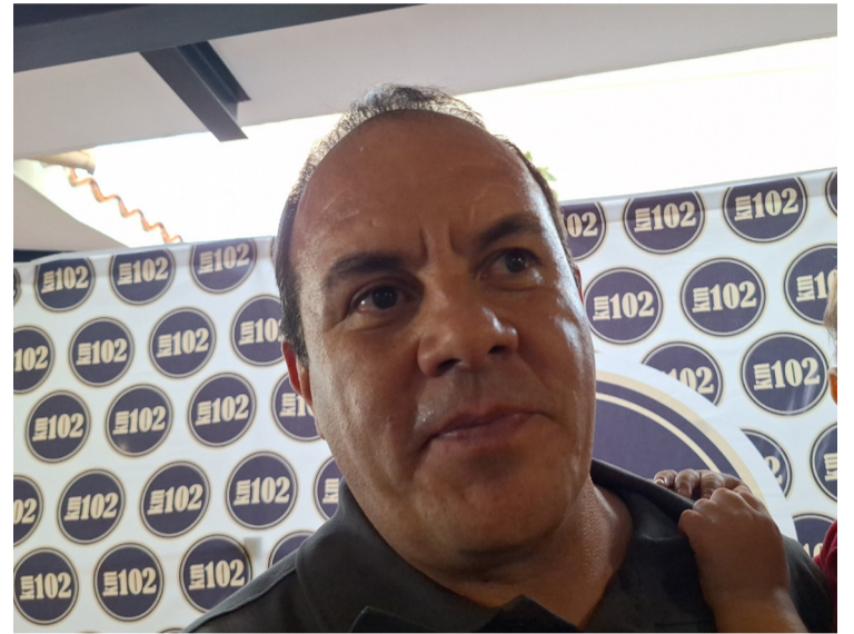
EL GOBIERNO DE MORELOS no cederá a las presiones de rutereros que exigen el incremento a la tarifa del transporte colectivo en un 40 por ciento.

Aunque no descartó que la solicitud de los transportistas por aumentar el pasaje sea un asunto político.