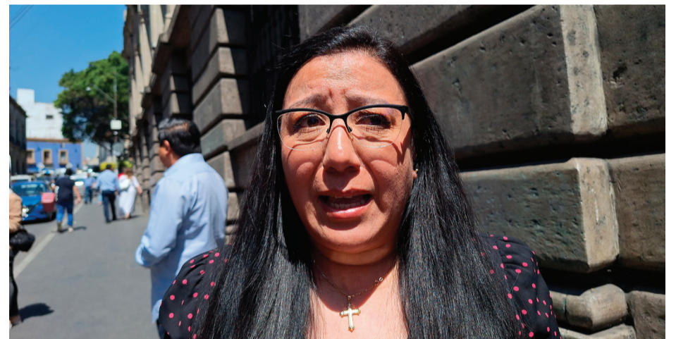
EL TRIBUNAL UNITARIO de Justicia Penal para Adolescentes (TUJPA) obtuvo una ampliación presupuestal de 2 millones de pesos por parte de la Secretaría de Hacienda estatal para el pago de pensiones.

Aunque precisó que aún falta una ampliación presupuestal de un millón y medio de pesos para cubrir otra pensión autorizada por el poder Legislativo, por lo que continuarán el diálogo con el gobierno estatal para abordar temas pendientes que requieren más recursos financieros.