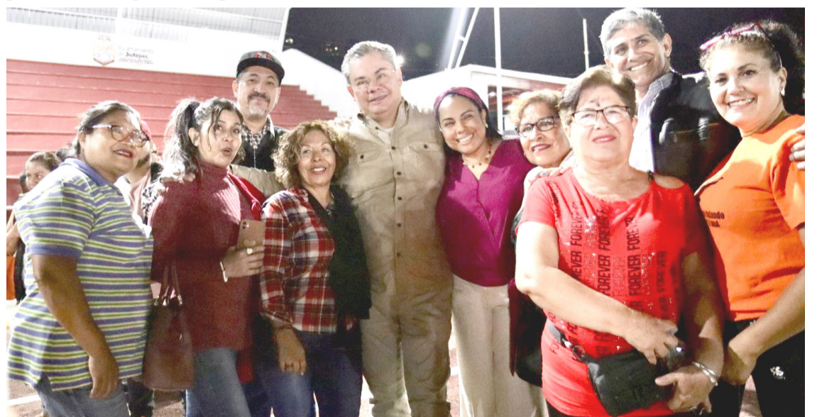
EL ALCALDE RAFAEL Reyes e integrantes del Ayuntamiento de Jiutepec entregaron, la rehabilitación del centro deportivo "Moisés Galindo", espacio público en la colonia Esmeralda en el cual se invirtió 10 millones 407 mil pesos para su mejoramiento.

Finalmente, precisó que se trata de una manifestación pacífica, pero no descartó cerrar los accesos a Cuernavaca en caso de que no sean atendidas sus demandas.