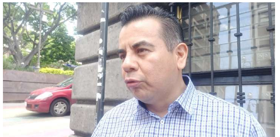
ALCALDES QUE NO decretaron Ley Seca este 15 y 16 de septiembre en sus municipios deberán realizar operativos para moderar el consumo de bebidas alcohólicas para prevenir hechos de violencia.

Finalmente, refirió que dentro de Palacio de Gobierno sólo se llevará a cabo el acto protocolario del Grito de Independencia.