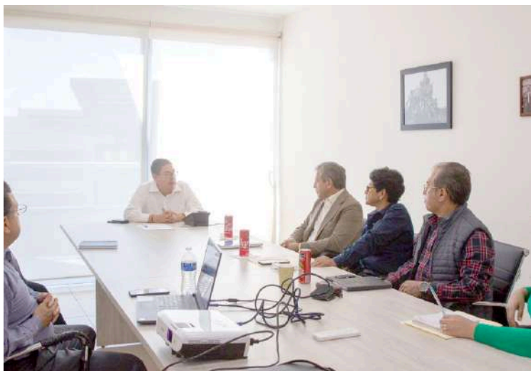
LOS GOBIERNOS de Morelos y Cuernavaca no permitirán ya más autos con permisos provisionales a partir de 2023.

Además anunció que se reunirá con las autoridades de Guerrero para tomar trabajar en acciones coordinadas para frenar la expedición de los permisos para circular en Morelos.