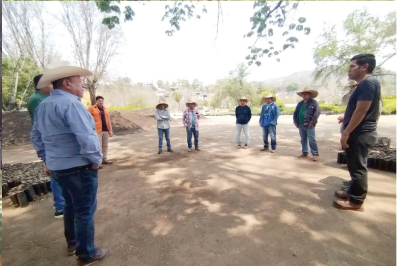
LA REFORESTACIÓN , en sus distintas modalidades, ayuda en el cuidado de las selvas y bosques morelenses; preserva la biodiversidad y los servicios ambientales; la recarga de mantos acuíferos, oxígeno, belleza escénica, entre otros.