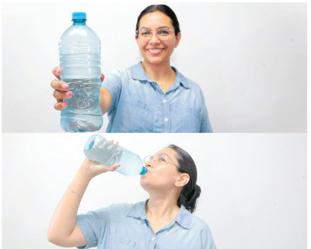
Ante las altas temperaturas que se registran en la entidad, Servicios de Salud de Morelos (SSM) emitió una serie de recomendaciones a la población para evitar la deshidratación.

Por último, SSM alertó que, en caso de presentar alguna sintomatología como: mareos, cansancio o irritabilidad, es importante acudir a su unidad de salud más cercana para recibir atención médica y Vida Suero Oral.