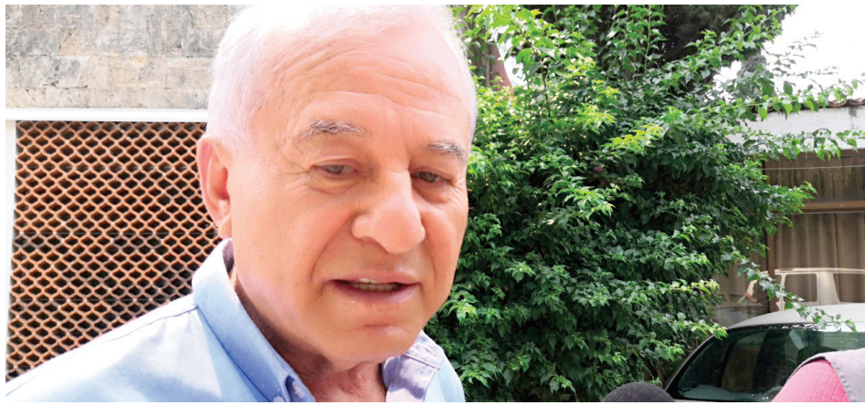
A MORELOS LLEGARON más de 5 millones 073 mil 668 boletas electorales que serán utilizadas el próximo 2 de junio. Las boletas y todo el material electoral es resguardado por el Ejército Mexicano y la Guardia Nacional.

Por cada cargo, es decir, Presidente de México, diputados federales y senadores, fueron entregadas 1 millón 691 mil 226 boletas electorales en los cinco distritos, dando un total de 5 millones 073 mil 668.