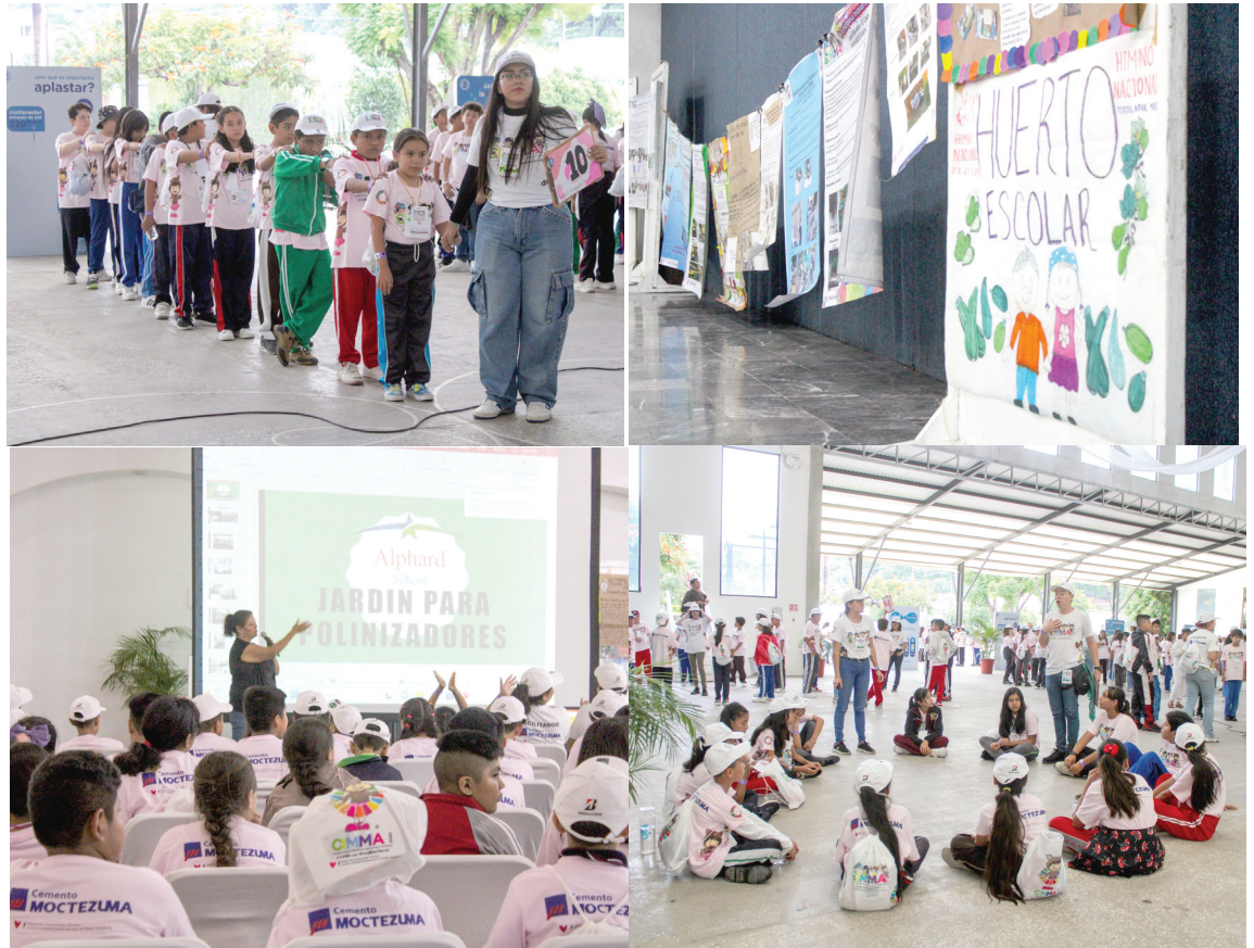
LA SECRETARÍA DE DESARROLLO Sustentable (SDS), a través de la Dirección General de Educación Ambiental y Vinculación Estratégica, dio a conocer que se registraron 213 escuelas de Morelos, así como del Estado de México, Querétaro, Sinaloa y Tlaxcala para participar en la vigésima quinta edición de la Cumbre Infantil Morelense por el Medio Ambiente (CIMMA) 2024, la cual acuña el lema "Agua para la Paz".

vocatoria completa en la plataforma sustainable.morelos.gob.mx o también al teléfono 777 317 5600 extensión 109 y 110 de la Dirección General de Educación Ambiental y Vinculación Estratégica.