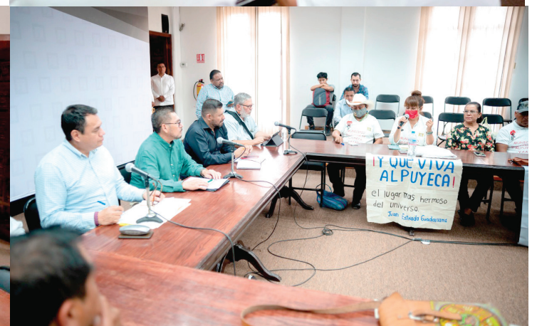
EL SECRETARIO DE Gobierno en funciones del titular del Poder Ejecutivo atendió a integrantes de la Unión de Municipios y Comunidades Indígenas y Afromexicanos del Estado de Morelos, con el propósito de dialogar y escuchar propuestas entorno al procedimiento de la creación del municipio indígena de Alpuyecaca.