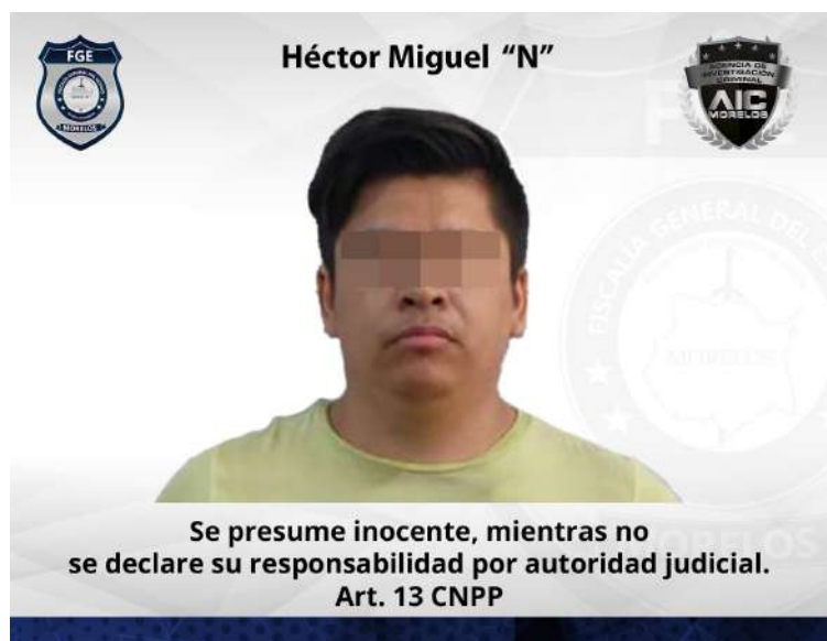
Héctor Miguel "N"

En la misma audiencia, al existir elementos de prueba en contra del imputado, el juez de la causa resolvió vincularlo a proceso, con medida cautelar de prisión preventiva y plazo de dos meses para el cierre de la investigación complementaria.