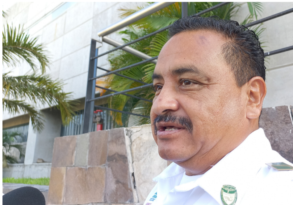
EN LA AUTOPISTA del Sol, en los límites con el estado de Guerrero se detectó la presencia de asaltantes confirmó la corporación Ángeles Verdes; además alertó a los automovilistas sobre las diferentes modalidades de asalto.

“No estamos haciendo una crítica de confrontación, pero es indiscutible que la seguridad pública en las carreteras debe reforzarse porque el modus operandi que consiste en la intercepción de los transeúntes en estas vialidades es algo que se puede disminuir si hay una mayor vigilancia y un despliegue presencia y disuasivo”, indicó el fiscal de Morelos.