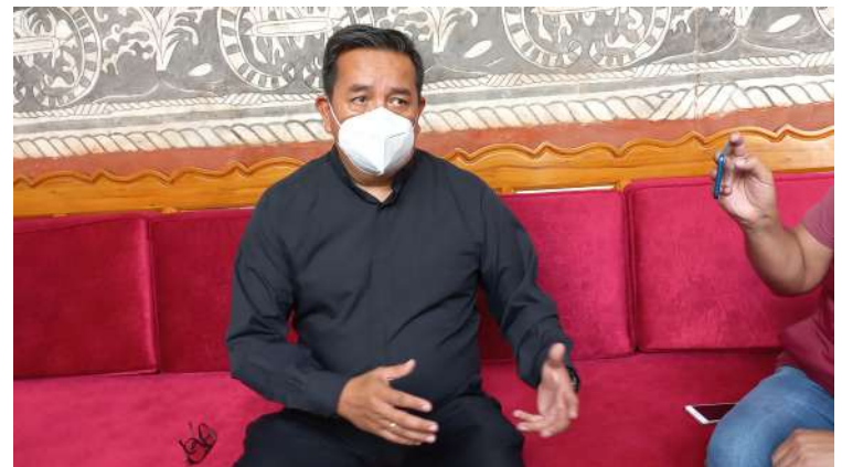
LA IGLESIA CATÓLICA consideró que la presencia militar en labores de seguridad ayudará a inhibir los niveles de delincuencia que vive Morelos.

Aunque, detalló que a diferencia del año pasado que marcharon hacia el zócalo de Cuernavaca, la caminata será de Tlaltenango hacia la catedral.