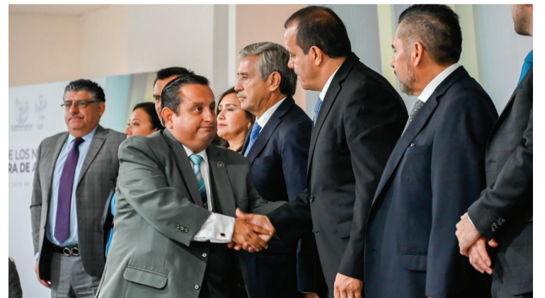
AL PARTICIPAR EN celebración del Día del Abogado, este 12 de julio, el gobernador Cuauhtémoc Blanco Bravo reconoció a las y los profesionales de la materia jurídica como “morelenses de excelencia”, al considerar que son “pieza fundamental en la consolidación del Estado de Derecho y la aplicación de la justicia” en la entidad.