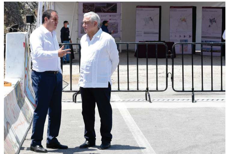
DERIVADO DE LAS gestiones del gobernador Cuauhtémoc Blanco Bravo, con el Presidente de México, Andrés Manuel López Obrador, el proyecto para la conclusión del “Puente Apatlaco” sigue vigente.

será el primer punto para presentar esta gran obra. Los actores aseguraron que el público que se atreva a presenciar esta gran obra, la risa estará garantizada por dos horas para divertirse sin parar, destacando que muchas de las parejas se sentirán identificadas en esta historia. La obra se realizó gracias al esfuerzo de empresarios morelense, por medio de Enserió Teatro. La obra de teatro de género comedia está basada en una historia de pareja para generar reflexión entre el público que asista a verla, garantizando diversión y risas por dos horas. El próximo jueves 18 de julio, en punto de las 8:30 de la noche, el escenario del Auditorio Teopanzolco estará listo para presentar esta obra titulada “Las Mujeres son de Venus y los Hombres ni Madres”.