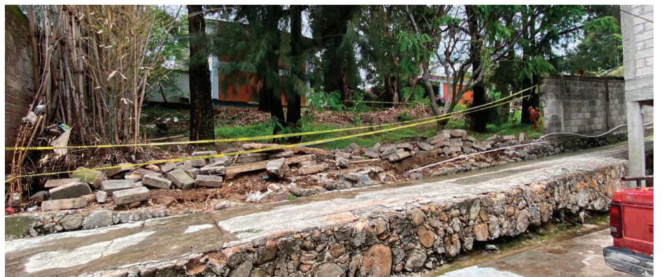
LA ESCUELA SECUNDARIA No.7 Francisco Zarco, del poblado de Tétela del Monte, resultó afectada tras el colapso de la barda perimetral.

“Aquí habrá mucha gente y trabajadores, espero y trabajen rápido y se termine la obra lo antes posible”, expresó.