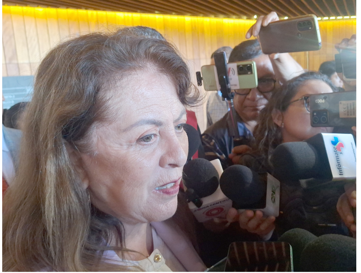
EN MORELOS CERO impunidad a delincuentes, afirmó la gobernadora Margarita González Saravia, aseguró que quien delinca será castigado, lo anterior, tras la tregua que pidió la iglesia católica a criminales.

En otro tema, dijo que se hicieron las gestiones en la federación para obtener recursos adicionales para la Universidad Autónoma del Estado de Morelos (UAEM). Finalmente, la jefa del Ejecutivo aseguró que continuará el apoyo de su gobierno a la máxima casa de estudios.