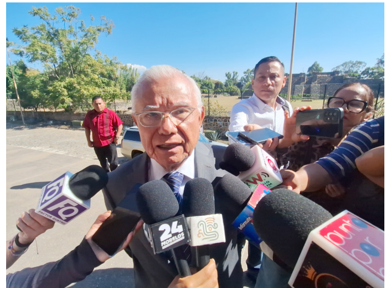
LA IGLESIA CATÓLICA y gobierno del estado se suman al llamado de pedir a grupos del crimen organizado a declarar una tregua en sus acciones violentas durante Navidad.