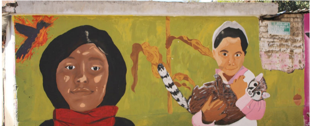
CULMINÓ LA CARAVANA Muralista en Contra del Olvido, en el poblado de Amilcingo Morelos, el cual contó con 21 Murales de conciencia, en diferentes puntos de la comunidad, para replicar el hacer comunidad en las trincheras de cada uno.