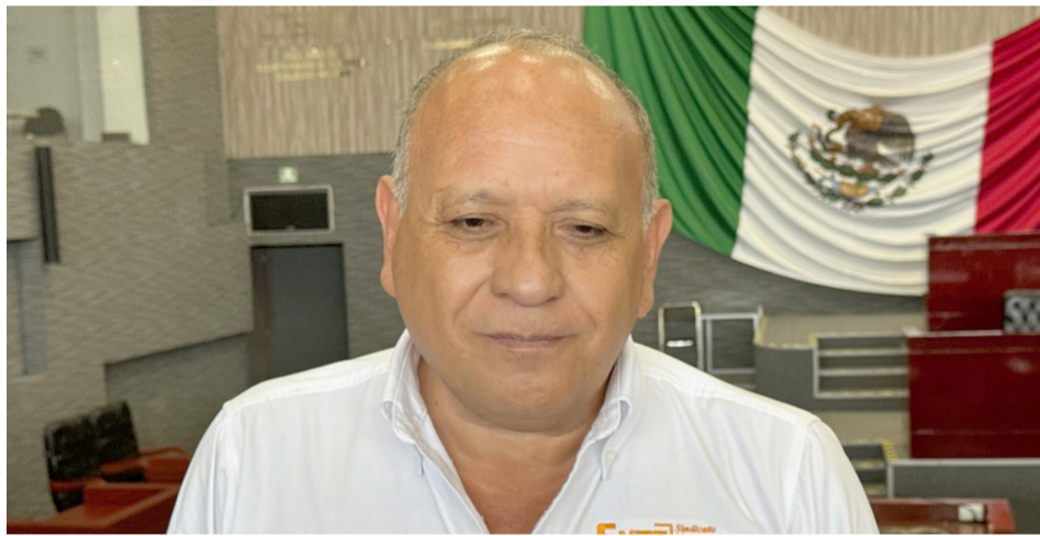
MAESTROS JUBILADOS Y pensionados de la entidad, arribaron al Congreso del Estado de Morelos, con el objetivo de solicitar a los legisladores que, aprueben la iniciativa con Proyecto de Decreto de la prima de antigüedad

Por lo que, uno de los grandes retos para las autoridades educativas, es combatir la desigualdad de oportunidades para garantizar que los niños y jóvenes tengan acceso a la educación gratuita y de calidad.