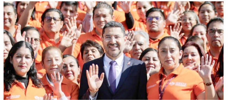
EL DIRECTOR GENERAL del Instituto de Seguridad y Servicios Sociales de los Trabajadores del Estado (Issste), Martí Batres Guadarrama, destacó el evento de clausura de los 16 Días de Activismo contra la Violencia de Género.