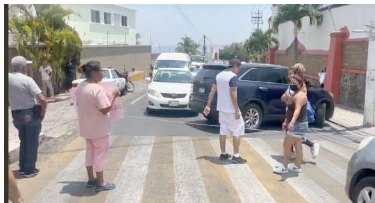
VECINOS DE LA COLONIA Ruiz Cortines del municipio de Cuernavaca se manifestaron la tarde de este miércoles para exigir el abasto de agua potable, ya que tienen más de 20 días sin el suministro.