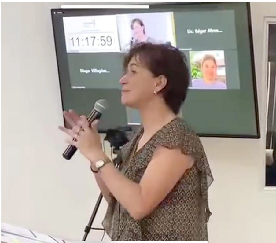
EL INSTITUTO MORELENSE de Procesos Electorales y Participación Ciudadana consideró como buena la ampliación presupuestal de 15 millones de pesos que le entregará el Poder Ejecutivo en los próximos días.