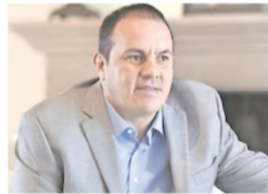
“No le importó que yo sea su hermana”; víctima narra presunto intento de violación por Cuauhtémoc Blanco