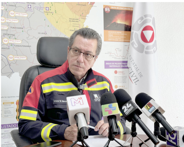
SIETE MUNICIPIOS DEL estado de Morelos sin entregar su Atlas de Riesgo, confirmó la Coordinación Estatal de Protección Civil (CEPC).

Finalmente, como muestra de los resultados entregados por el Gobierno de Morelos, a través de la SDEyT, las y los morelenses tienen certeza en los derechos y garantías laborales, además son testigos del comienzo de la transformación en Morelos que da como resultado el desarrollo económico.