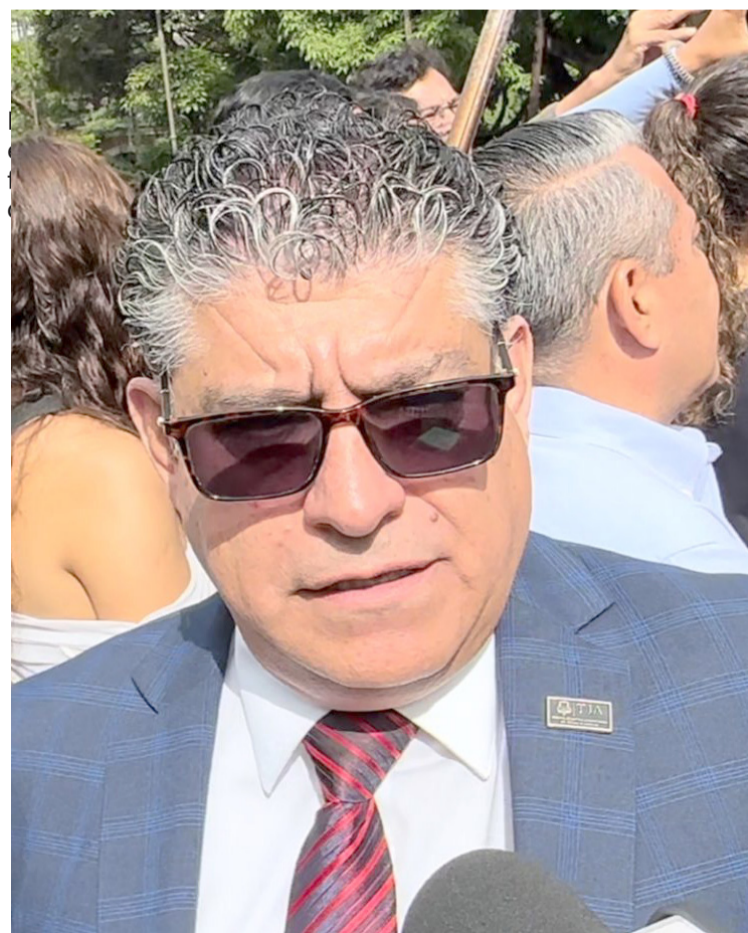
DE CINCO A ocho procedimientos se registran a la semana en el Tribunal de Justicia Administrativa, en contra de las infracciones que se levantan por parte de policías de Tránsito en diferentes municipios.

“Por los operativos en sí mismos siguen llegando el número de demandas normal, es decir, estamos recibiendo entre tal vez unas cinco u ocho demandas por semana, pero por las infracciones de tránsito que ocurren en el día con día, es decir, alguien que se pasó un alto, alguien que se estacionó en una línea equivocada, en línea roja, esas son las amonestaciones”, concluyó Arroyo Cruz.