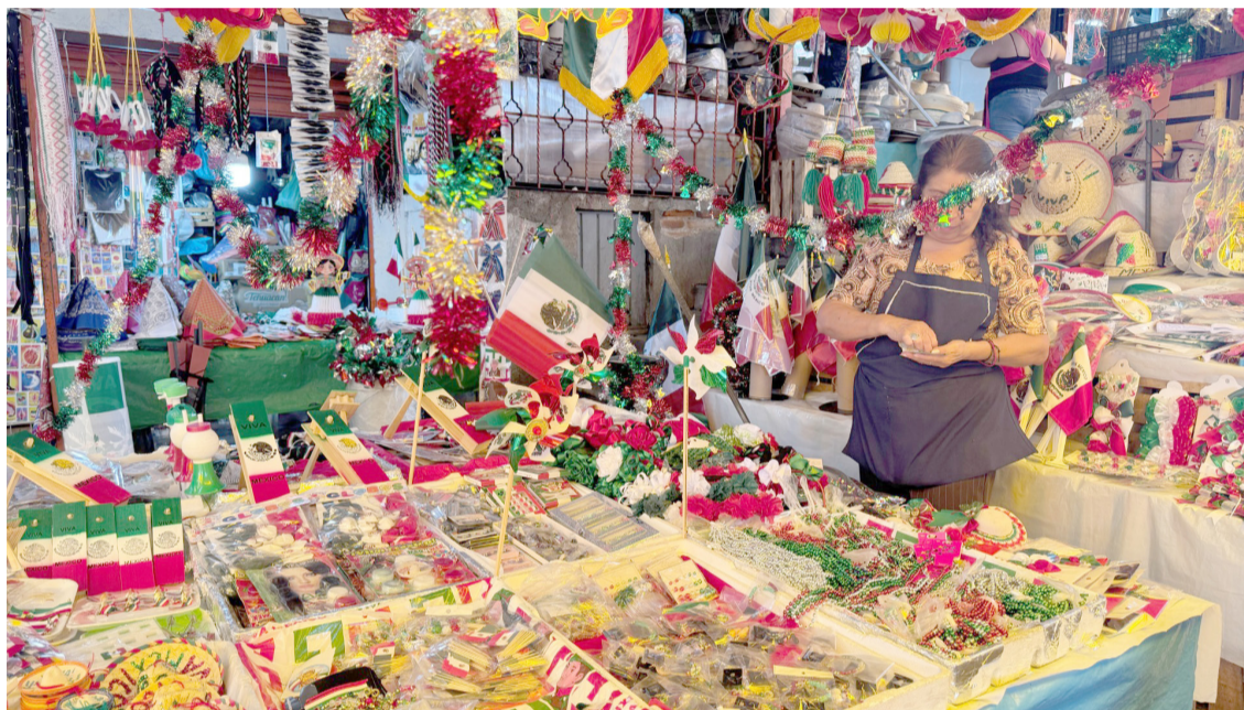
PREVIO A LA noche mexicana, se desploma la venta de artículos decorativos del mes patrio en el Mercado Adolfo López Mateos en Cuernavaca.

“Lo chino es desechable y lo de México dura hasta tres años”, indicó.