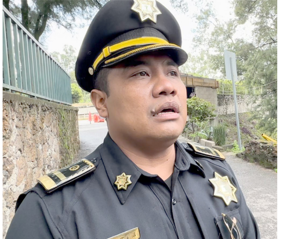
EN LAS AVENIDAS Río Mayo, Plan de Ayala y Palmira del municipio de Cuernavaca, es en donde más accidentes viales se registran debido a que los automovilistas exceden los límites de velocidad.

Finalmente, la CEPCM recordó los números 9-1-1 y (777) 100 0515 para solicitar el apoyo de los servicios de emergencia y solicitó usar las líneas telefónicas de manera responsable.