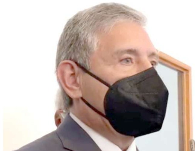
EL ALCALDE DE CUERNAVACA , José Luis Urióstegui Salgado dejó en claro que en su gobierno no habrá impunidad y mucho menos solapamiento para ex servidores públicos que hayan incurrido en actos constitutivos de algún delito.

Es decir, no se les pagó puntualmente el viernes pasado al personal pero fue porque se realizó el cambio de cuenta bancaria con otra institución distinta a la que se tenía, y por lo tanto, no se hizo de forma oportuna la dispersión de recursos ya que las condiciones no fueron las propicias para hacer los pagos salariales de manera oportuna en favor de los empleados. Aclaró que a partir de las primeras horas de este lunes el asunto ya fue solucionado.