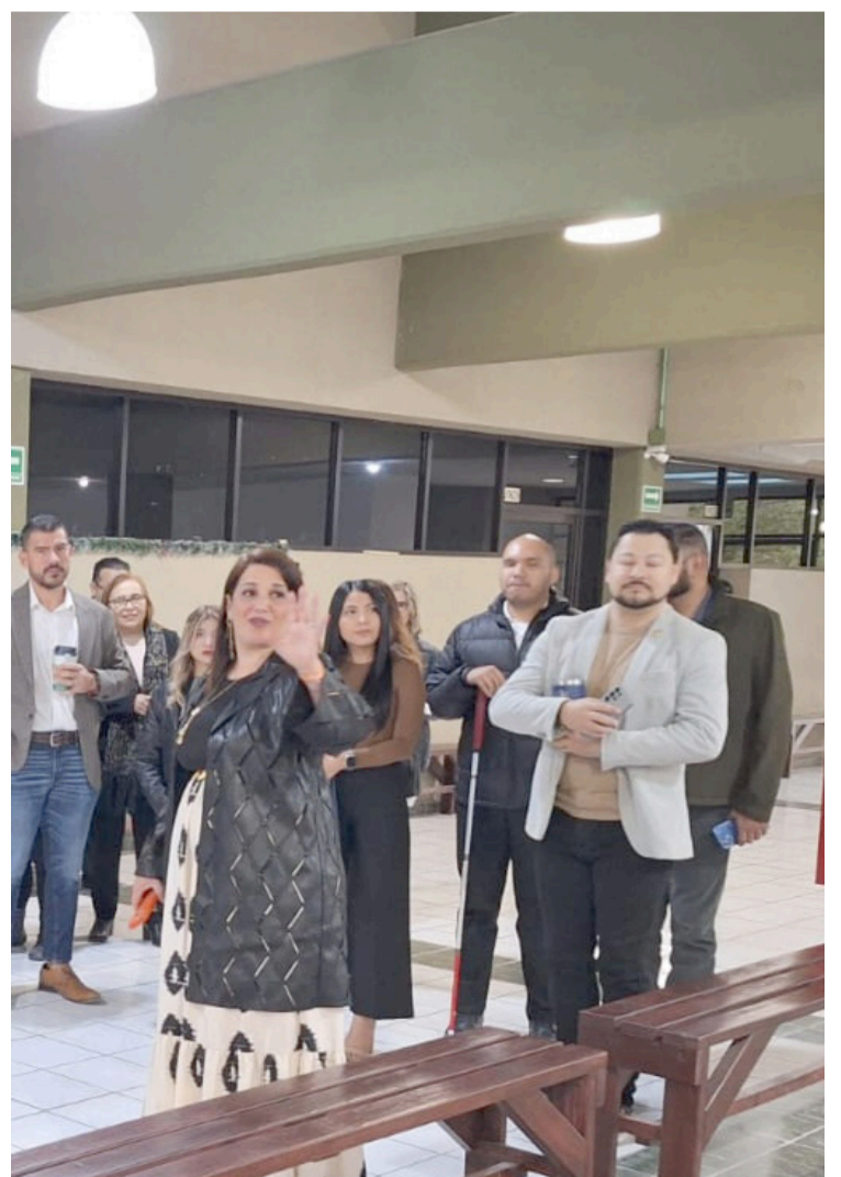
LA UNIVERSIDAD TECNOLÓGICA del Sur del Estado de Morelos (UTSEM) fue galardonada con el distintivo DIISTINGUEUT en la categoría plata.