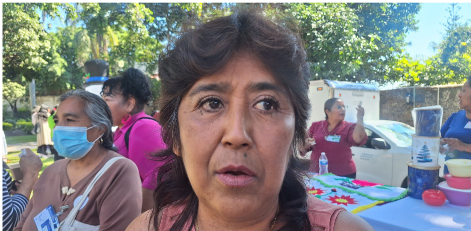
LA RED DE Mujeres Constructoras de Paz (MUCPAZ) 2024 denunció que persiste el acoso sexual en transporte público de pasajeros en su modalidad de rutas.