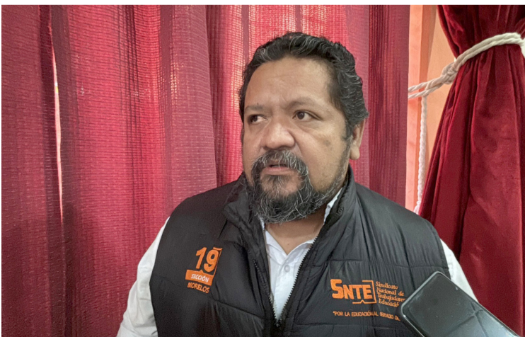
MAESTROS JUBILADOS, PENSIONADOS y homologados en Morelos, exigen el presupuesto de cerca de 300 millones de pesos para el pago de sus aguinaldos.

Lamento que desafortunadamente debe realizar cualquier tipo de acciones movilizaciones sociales, de vialidades para ser escuchados a través de sus matizaciones o protestas.