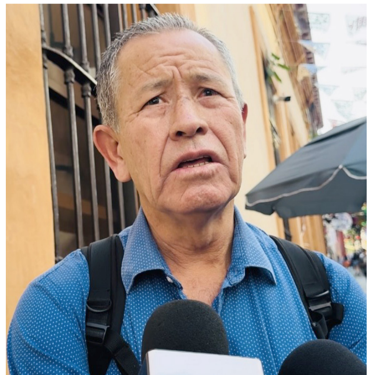
EN ENTREVISTA EL vocero indicó que, los temas que aún siguen pendientes a la ciudadanía es el combate a la inseguridad en la capital morelense, así como mayor inversión a los problemas hidráulicos por falta de agua y el manejo deficiente en la Sapac.

navaca se propiciado en contra de los problemas de fugas de agua y el mal funcionamiento dentro del Sistema de Agua Potable y Alcantarillado del Municipio de Cuernavaca (SAPAC).