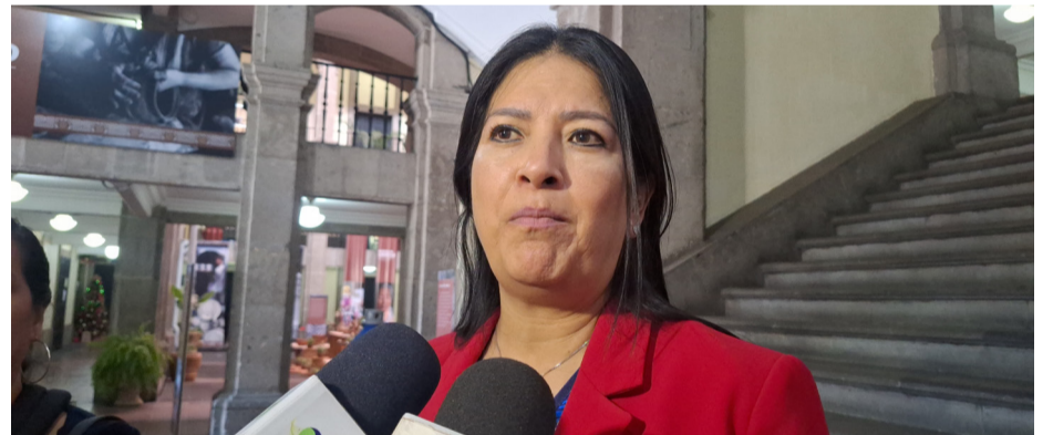
AÚN DESCONOCE LA Secretaría de Hacienda del Gobierno del estado de donde obtendrá los recursos para cumplir con el decreto de la Suprema Corte de Justicia de la Nación para otorgar la autonomía financiera al Tribunal Superior de Justicia.

Pero aseguró que en el 2025 con los recursos que se tengan se atenderán las necesidades en campo, seguridad pública, bienestar e infraestructura