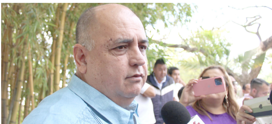
LA SECRETARÍA DE Movilidad y Transporte del Gobierno del estado reconoció un aumento de autos particulares que presta el servicio de taxi a la Ciudad de México.