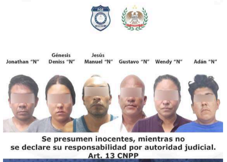
Se presumen inocentes, mientras no se declare su responsabilidad por autoridad judicial. Art. 13 CNPP