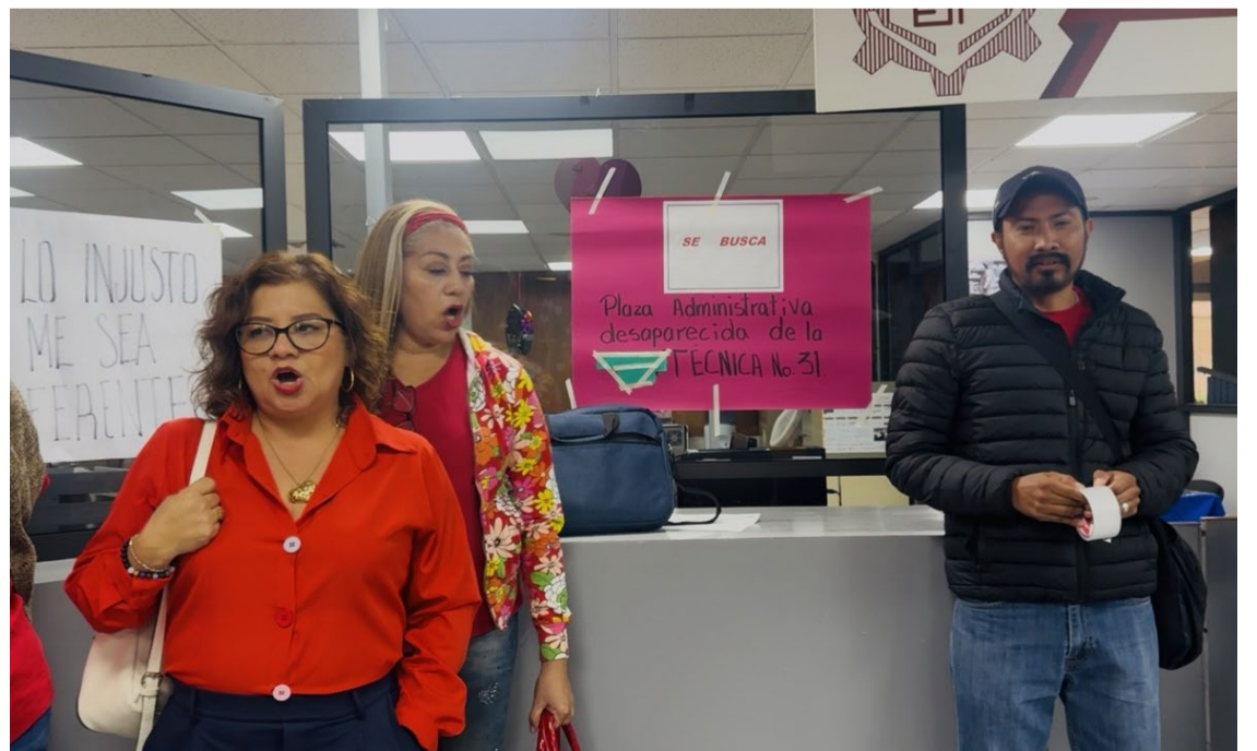
ANTE EL PRESUNTO desvío de una plaza administrativas en la Escuela Secundaria Técnica No.31, maestros exigen que se respeten los derechos laborales del personal de apoyo educativo (PAE).

Revelaron que, al menos otras dos plazas de intendencia y biblioteca las cambiaron, donde los más afectados son los estudiantes, puesto que, no cuentan con el personal que les otorguen estos servicios dentro de las instalaciones y son ellos quienes se ven obligados a realizar este tipo de actividades.