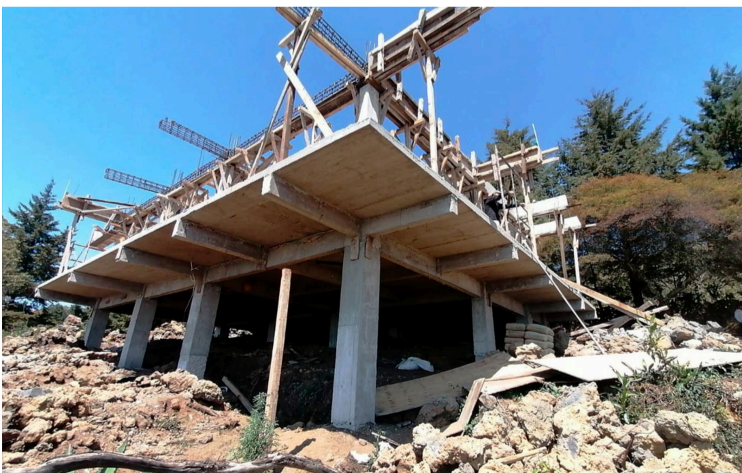
POR ESTAR UBICADA dentro del polígono del área nacional protegida Parque Nacional El Tepozteco y por carecer de autorización, la Profepa clausuró la construcción de una casa habitación ubicada en el paraje “Cocuajtla”, de San Juan Tlacotenco

Cabe agregar que la Dirección del Parque Nacional El Tepozteco, de la Comisión Nacional de Áreas Naturales Protegidas, presentó ante la Profepa una denuncia por escrito de los hechos el pasado 28 de febrero.