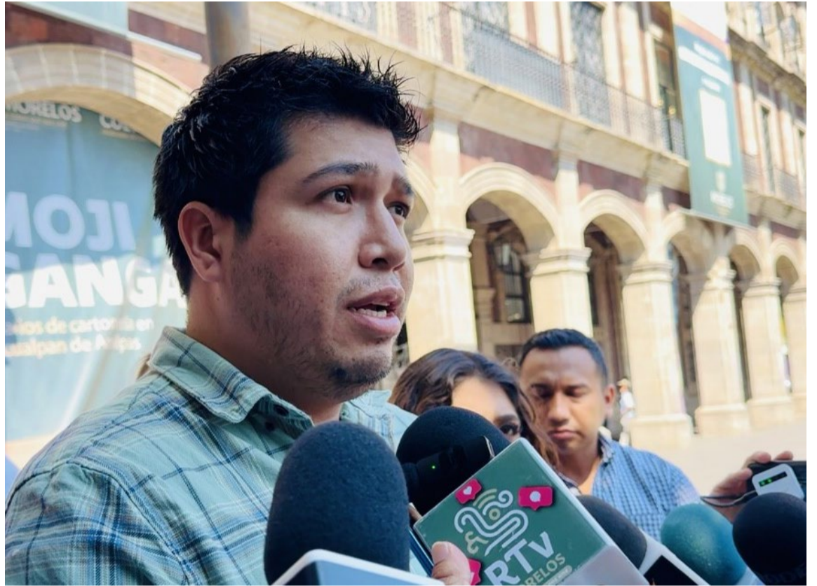
MAESTROS DEL MOVIMIENTO Insurgencia Magisterial exigen que se derogue la Ley del Instituto de Seguridad y Servicios Sociales de los Trabajadores del Estado (ISSSTE) 2007, debido a que, impide jubilarse de manera digna.