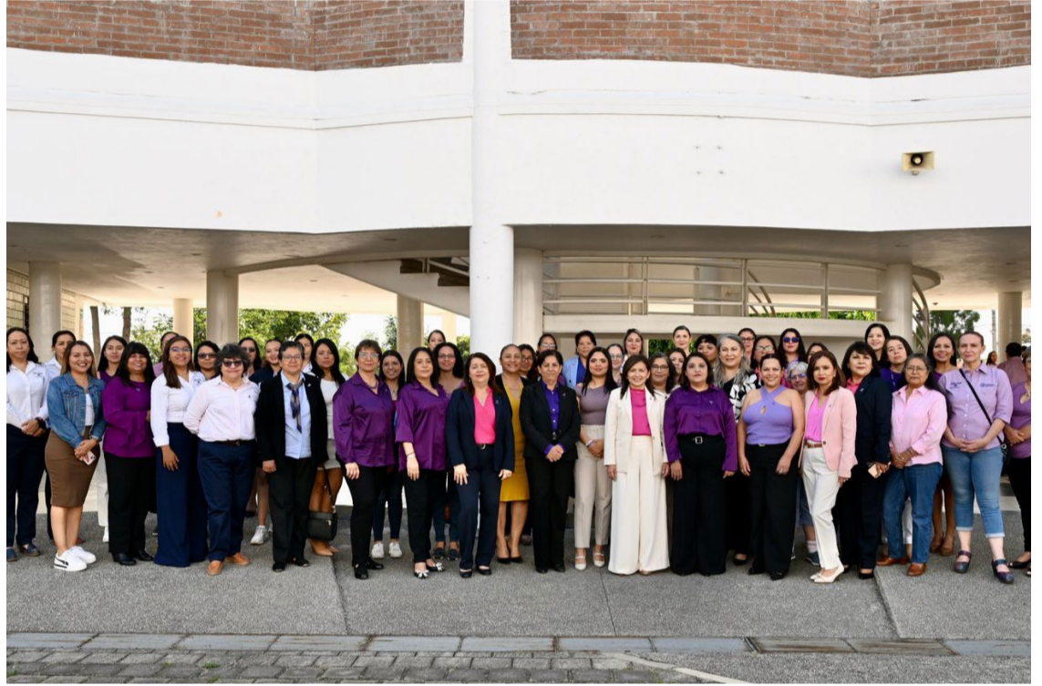
EN EL MARCO del Día Internacional de la Mujer, la FCQeI, en conjunto con el Ciidu, la Escuela de Teatro, Danza y Música, y la Unidad de Género, Igualdad y No Discriminación de la UAEM, realizaron este día el VIII Encuentro Universitarias en la Ciencia, Tecnología y Sociedad 2025.

en Humanidades (CIHu) y secretaria técnica de la Comisión Especial de Igualdad de Género y No Discriminación del Consejo Universitario.