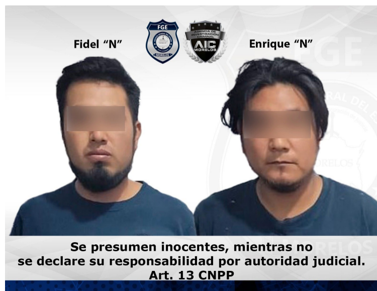
Se presumen inocentes, mientras no se declare su responsabilidad por autoridad judicial. Art. 13 CNPP