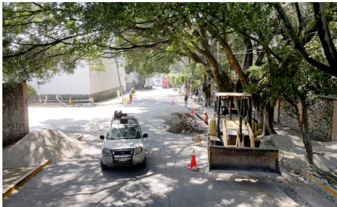
PERSONAL ADSCRITO al Organismo de la Cuenca Balsas, se realizó un recorrido de inspección para verificar la existencia de obras realizadas o que estén realizando, la Conagua, informó que no ha otorgado permiso alguno para la perforación de un pozo de agua.

Con ello, los 15 legisladores buscan mantener el control al interior del Congreso, sin consensuar a sus homólogos del G5. Además podrán retirar las comisiones legislativas con tales modificaciones.