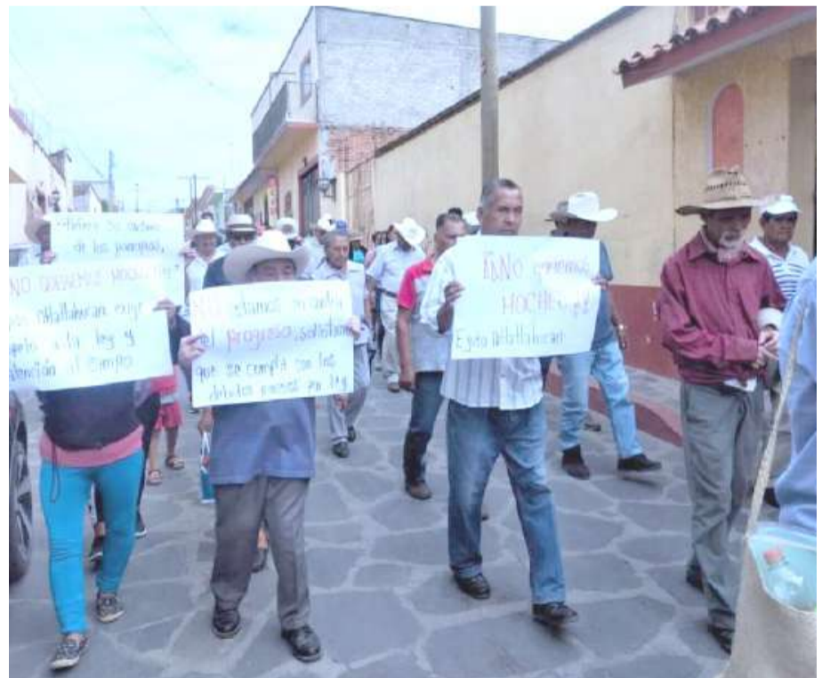
CON UNA MARCHA para exigir respeto a sus derechos a la presidenta municipal de Atlatlahucan, Alma Delia Reyes Linares, pidieron el pago de siete millones de pesos por “derechos de vía”, en los terrenos donde introduce el sistema de agua potable del rancho “Cuachizolotera”.

Matizó que, en presunta represalia, el ayuntamiento clausuró la obra de construcción de sus instalaciones ejidales, aunque reconoció que no han pagado los permisos correspondientes. “Nos pidieron la documentación, nos pidieron conciliar con nuestros vecinos; también ya lo hicimos y estamos dispuestos a actuar conforme a la ley; si nos piden el pago, también estamos dispuestos, pero nos las cancelaron en un abuso de autoridad”, confirmó.