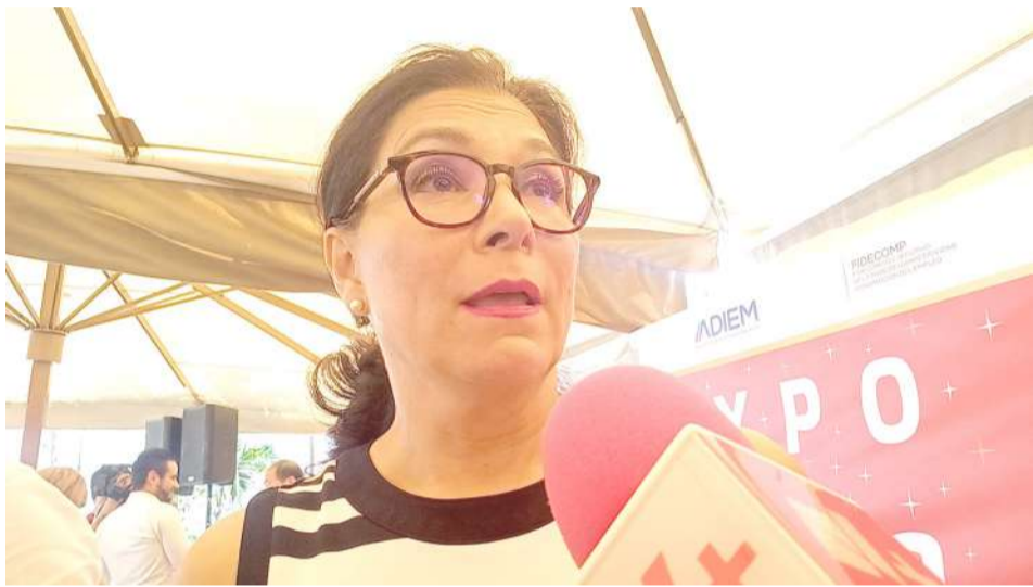
LA SECRETARÍA DE Desarrollo Económico y del Trabajo del Gobierno del estado, pidió a la policía Morelos implementar estrategias de seguridad en las inmediaciones de los centros laborales

Explicó que la obra tendrá una duración de un año, además el monto de inversión es superior a los 119 millones de pesos.