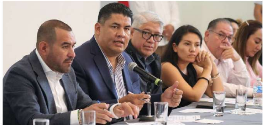
EL PRESUPUESTO APROBADO por los diputados del Congreso del estado para el próximo año, beneficiará a la Fiscalía, a la Comisión Estatal de Seguridad y al Poder Judicial.

el Presupuesto de Egresos 2023 aprobado por los legisladores morelenses, redundará en el beneficio de los morelenses al propiciar un mejoramiento en las labores de prevención, procuración e impartición de justicia.