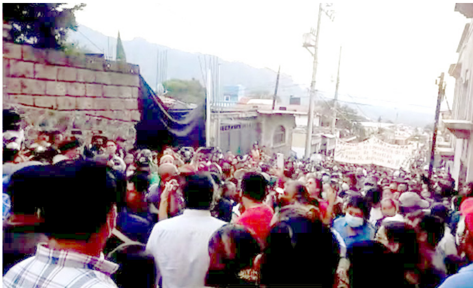
POLÍTICOS QUE LABORARON en los gobiernos municipales de al menos los últimos tres administraciones de forma irregular adquirieron terrenos.

Por lo que a pesar del llamado que hizo el titular del Poder Ejecutivo federal de las denuncias y movilizaciones que la propia ciudadanía ha realizado frecuentemente para frenar este daño ecológico que le están provocando al municipio, no ha servido de nada porque hay evidencias de que se sigue registrando la tala de árboles y la venta irregular de terrenos en la zona.