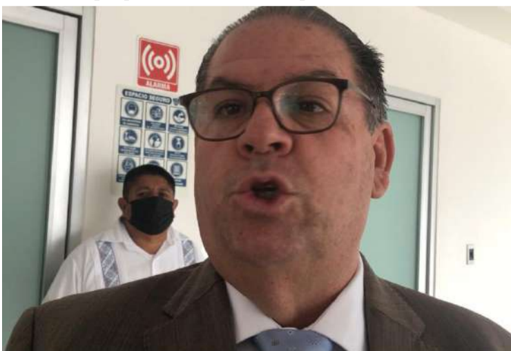
EL DIPUTADO ÓSCAR CANO Mondragón del PAN, acusó que la ESAF, la Fiscalía Anticorrupción, la Contraloría del estado y municipales no han dado resultados para frenar los actos ilícitos.

Y es que cabe recordar, que esta solicitud inició desde la pasada legislatura por lo que se espera que pueda avanzar el proceso y ser sometido al Pleno del Congreso local.