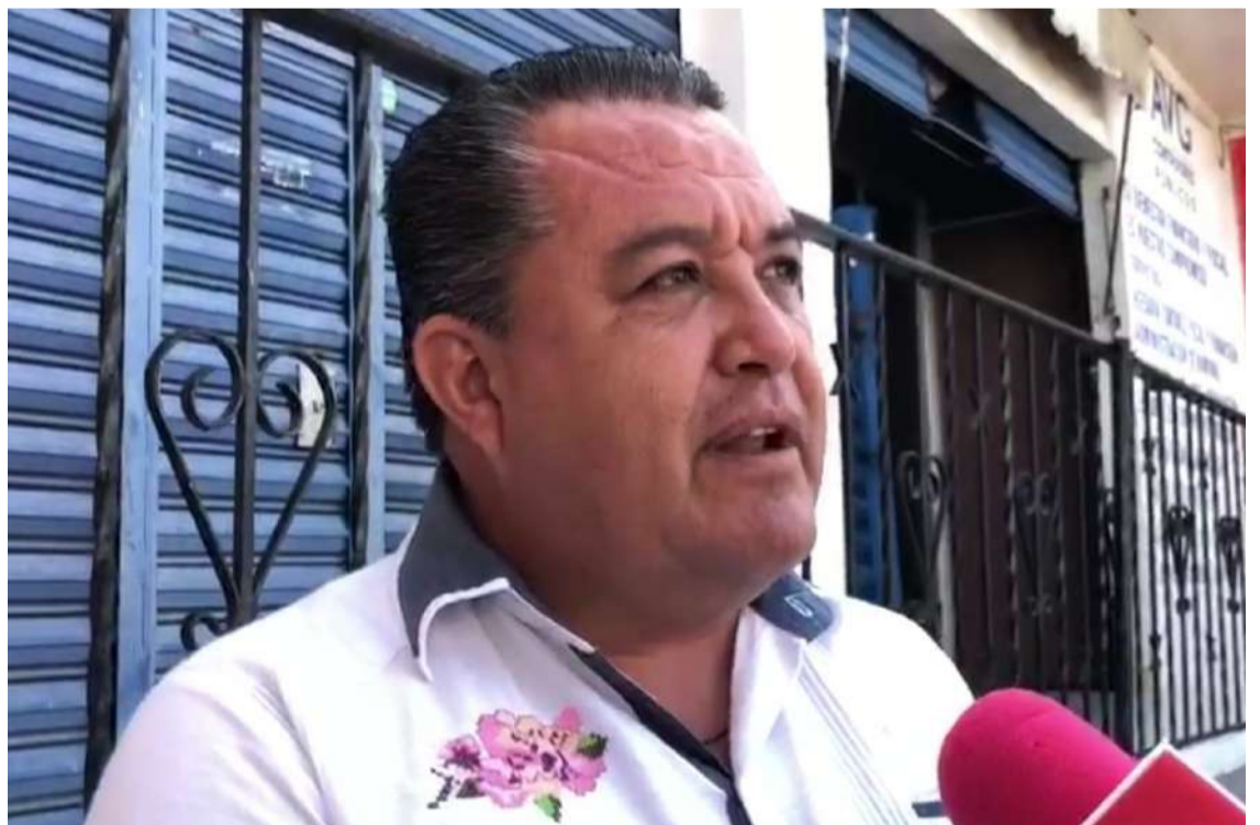
ANTE LOS ÚLTIMOS HECHOS de inseguridad que se han registrado en el municipio de Cuautla, empresarios hicieron un llamado a las autoridades de los tres niveles de gobierno a reforzar los operativos para disminuir la incidencia delictiva en este lugar.