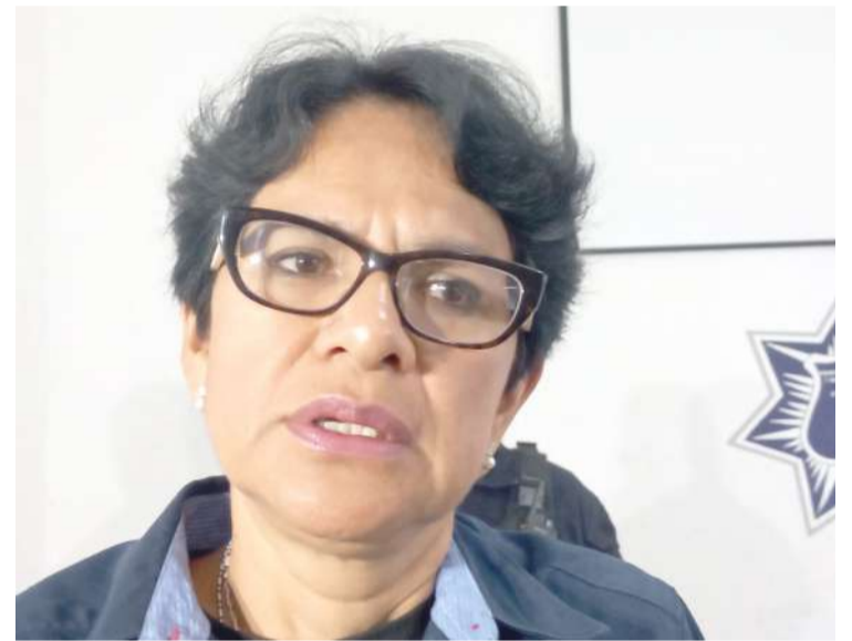
SEGÚN LA POLICÍA de Cuernavaca, los delincuentes que “atemorizan a los capitalinos y provocan violencia en la ciudad”, son sujetos provenientes de otros estados del país o municipios de Morelos.