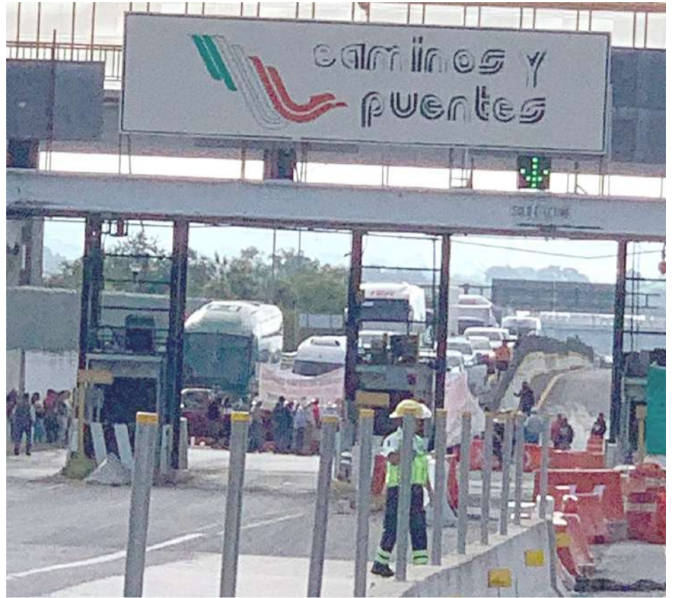
EJIDATARIOS DE TLAYACAPAN, Tepoztlán y Yauatepec exigen a La SICT el pago correspondiente de las tierras ejidales que les vendieron para ampliar los carriles de la autopista La Pera-Cuautla, luego de realizar un nuevo bloqueo.

Precisaron que no era posible que no haya interés de parte del secretario de la SICT, porque no “pueden decirnos que se encuentra en Acapulco, Guerrero, eso no es cierto, que nos atiendan es lo que pedimos”, recalcaron.