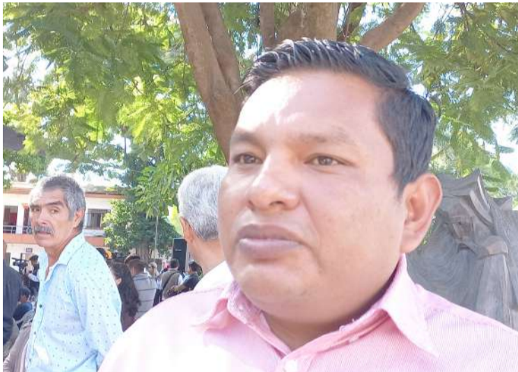
EL COMITÉ ESTATAL de Sanidad Vegetal alertó sobre el incremento de plagas que ponen en riesgo a las hectáreas y que afectan a varias regiones de Morelos.

va en las acciones operativas para disminuir la incidencia delictiva en los municipios, “porque las personas que delinquen en Cuernavaca ingresan por los municipios que colindan con la ciudad, lo mismo ocurre en los límites con Guerrero, Estado de México y Ciudad de México.