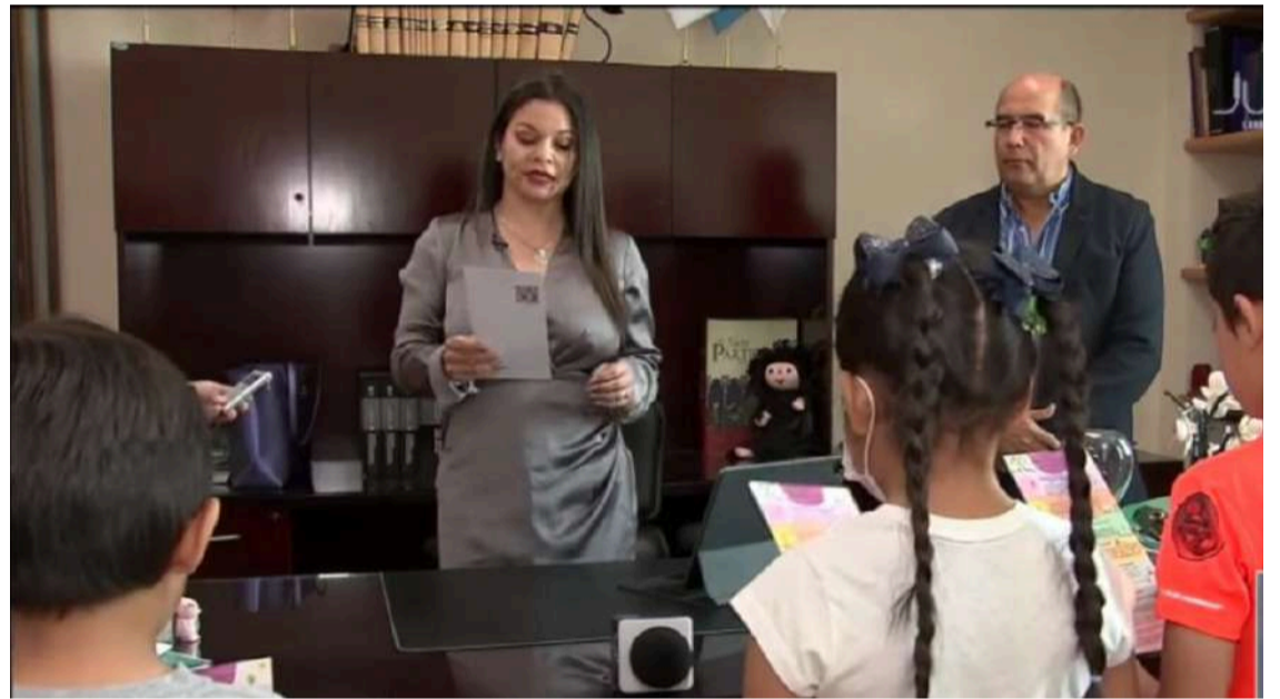
EN UNA DETERMINACIÓN judicial histórica, un grupo de niños de CIVAC logró detener la construcción de una plaza comercial que implicaría dejarlos sin su único parque.

http://sise.cjf.gob.mx/SVP/world1.aspx?arch=753/0753000028783613028.pdf&sec=RodolfoAndr%C3%A9sMart%C3%ADnezHidalgo&svp=1