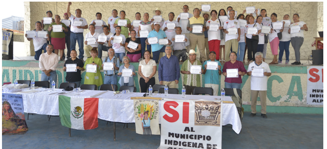
INVESTIGADORES DE LA UAEM y personal del Instituto Nacional de Pueblos Indígenas (INPI) Delegación Morelos, entregaron 80 reconocimientos a promotoras y promotores de la creación y elaboración del estatuto de autonomía y libre determinación de Alpuyeca.