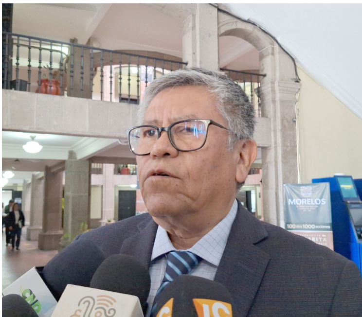
GRUPOS DELICTIVOS DE Guerrero y Estado de México llegan a Morelos y viceversa, aseguró el subsecretario de Gobierno, Miguel Ángel Peláez Gerardo.

"No es el único tema la inseguridad, también tenemos problemas por límites territoriales que han generado tensión social y lo estamos atendiendo para no generar conflictos", finalizó Peláez Gerardo.