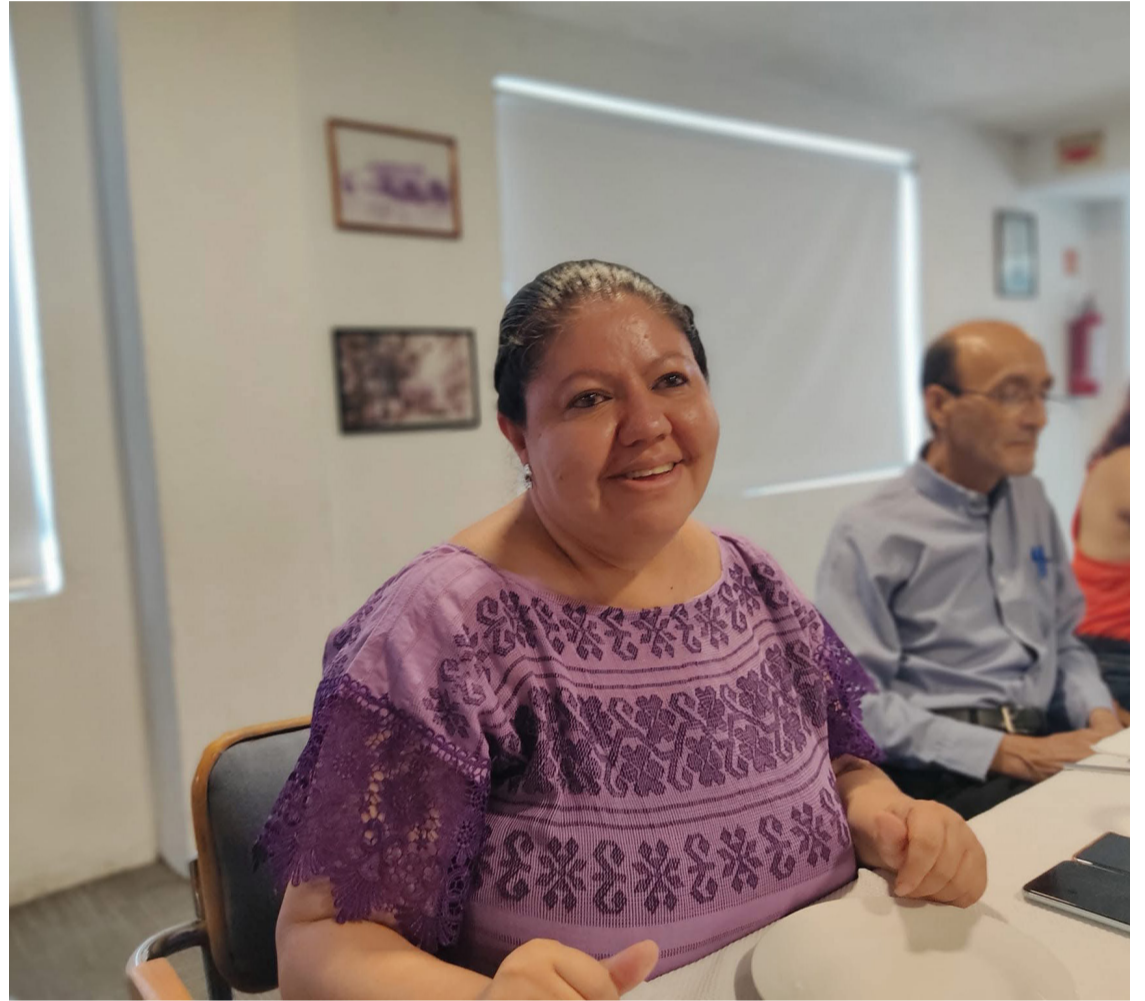
EMPRESARIOS DE MORELOS rechazaron la intención que tienen 12 organizaciones sociales para convertirse en partidos políticos, ya que los recursos que se destinan para prerrogativas deben invertirse en obra pública y seguridad.

lar, Liderazgo Morelos, Partido Primavera Morelense, A Pasos Agigantados de Vida, Sociedad Progresista de Morelos y Partido Incluyente Democrático.