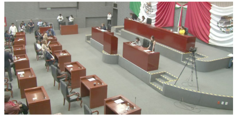
CON 16 VOTOS a favor y 4 en contra, la Legislatura LVI destituyó de manera definitiva a Uriel Carmona Gándara como fiscal General del Estado de Morelos.