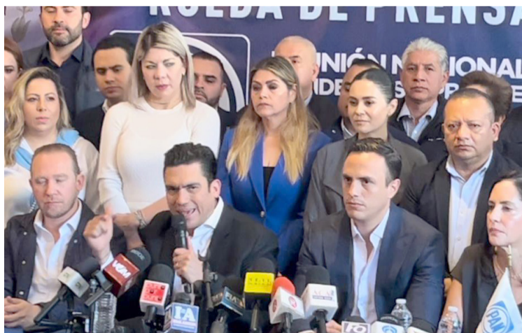
EL PARTIDO ACCIÓN Nacional (PAN) en el Congreso de la Unión votará a favor del proceso de desafuero en contra del diputado federal y exgobernador de Morelos,

En ese sentido, reiteró que el Partido Acción Nacional seguirá su línea de no prejuzgar, pero sí de estar vigilantes de que cualquier persona, sin importar su posición política, sea tratada de acuerdo con la ley. Además, remarcó la importancia de que el país continúe avanzando hacia un sistema de justicia que garantice la imparcialidad y la rendición de cuentas.