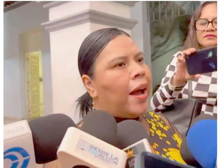
LA VIOLENCIA Y el maltrato hacia los animales en el municipio de Cuernavaca han aumentado de manera alarmante, según denunció la Fiscal Ambiental, Wendy Salinas.

Mencionó que las campañas de concientización sobre la adopción, la esterilización y la correcta atención de los animales son cruciales para prevenir futuros casos de abuso y abandono.