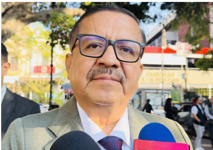
EL INSTITUTO DE Educación Básica del Estado de Morelos (IEBEM), respalda el uso del “Uniforme Neutro” en los planteles educativos.

De acuerdo con el presidente de la asociación, el uniforme neutro sólo provoca rebeldía en los niños de la educación y que empiecen a desobedecer sobre las reglas que se deben cumplir dentro de los centros educativos. Comentó que, el Congreso del Estado de Morelos debería de legislar a favor y en beneficio del sector educativo, con otro tipo de iniciativas y leyes que realmente coadyuven al desarrollo académico y aprendizaje de los alumnos de los diferentes niveles educativos, principalmente en educación básica.