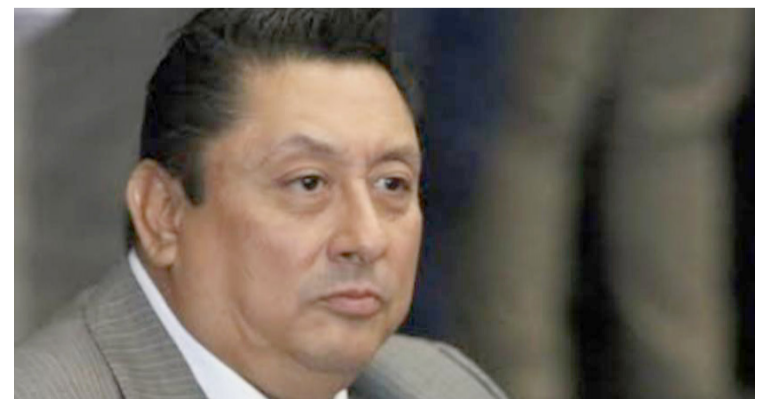
EL HOY EXFISCAL de Morelos, Uriel Carmona Gándara, solicitó a la Cámara de Diputados que se lleve a cabo el desafuero de Cuauhtémoc Blanco.

Todo esto, antes de que los diputados de Morelos determinaran, por mayoría, defenestrar al encargado del Ministerio Público morelense.