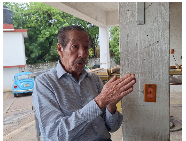
EL USO DE celulares y exceso de velocidad son las principales causa de los accidentes resguardos durante este primer fin de semana largo en ma autopista México-Acapulco.

Finalmente, dijo que es una de las vías de comunicación donde se registran más accidentes por el mayor flujo de vehículos que conecta a varios municipios y estados.