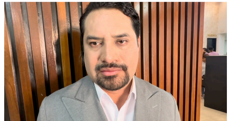
DEBIDO A LA falta de resultados y su cercanía con el ex gobernador de Morelos, Graco Ramírez, abogados consideraron que es urgente un cambio en la Comisión de Derechos Humanos del Estado de Morelos.