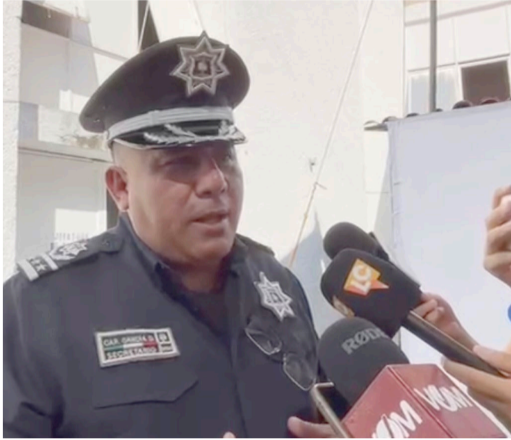
A PARTIR DE las 19:00 horas es cuando más se registra el robo de vehículos en Cuernavaca.

García Delgado concluyó, al hacer un llamado a los ciudadanos para tomar precauciones y evitar el robo de sus vehículos.