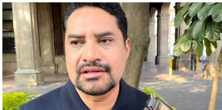
ABOGADOS DE MORELOS solicitaron a los diputados del Congreso local que lleven a cabo una auditoría a la Legislatura pasada, con el fin de que se rinda cuentas sobre el gasto que se hizo del presupuesto.