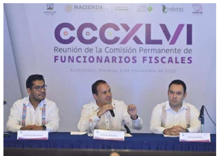
EL GOBERNADOR del estado de Morelos, Cuauhtémoc Blanco Bravo, encabezó la mañana de este viernes la CCCXLVI Reunión de la Comisión Permanente de Funcionarios Fiscales, la cual busca generar políticas públicas para fortalecer las finanzas públicas.

Cabe mencionar, que la Comisión Permanente de Funcionarios Fiscales está integrada por la Secretaría de Hacienda, Presupuesto y Cuenta Pública, y autoridades de ocho estados del país entre los que se encuentran Baja California, Coahuila, Tlaxcala, Aguascalientes, Guanajuato, Ciudad de México, Veracruz y Quintana Roo, además de que en esta ocasión acudieron como invitados Chiapas y Sinaloa.