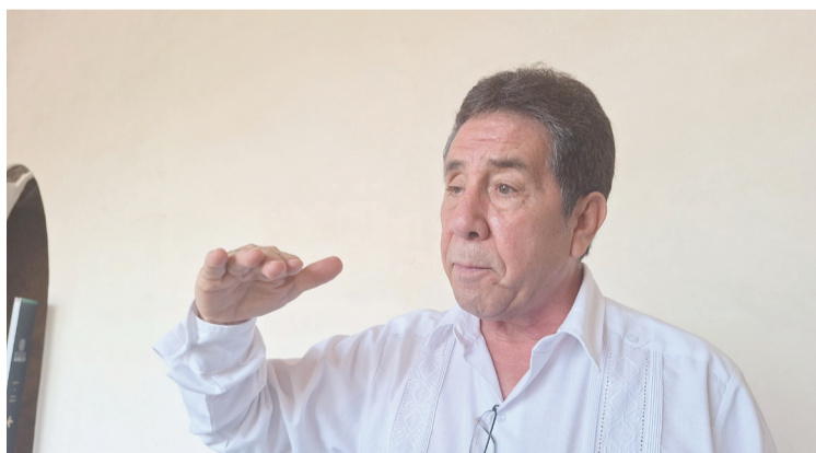
DURANTE LA TEMPORADA de lluvias, el Instituto Nacional de Antropología e Historia, podría cerrar el acceso a la Zona Arqueológica El Tepozteco por el peligro que representa para los visitantes dicho espacio.