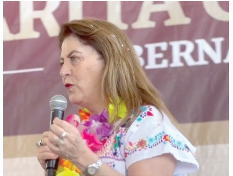
DESDE AXOCHIAPAN, la gobernadora electa Margarita González Saravia celebró el nombramiento de Omar García Harfuch, de quien dijo, “tengo excelente relación y ya hemos hablado de la creación de la Secretaría de Seguridad Pública en Morelos”.

Omar García Harfuch, gracias a su especialidad en seguridad, fue nombrado el próximo secretario de Seguridad y Protección Ciudadana.