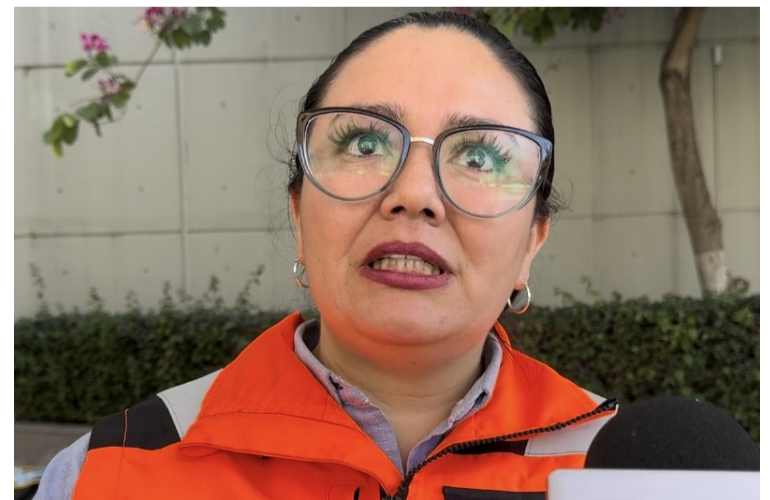
LA COORDINACIÓN MUNICIPAL de Protección Civil ha notificado a los directores de los Mercados en Cuernavaca, para evitar la venta, distribución y almacenamientos de pirotecnia en la capital morelense.

Si bien, no se han detectado puntos de distribución o almacenamiento de pirotecnia en Cuernavaca hasta el momento, las autoridades mantienen una vigilancia constante y están implementando las medidas necesarias para prevenir su comercialización. La coordinadora municipal hizo un llamado directo a los habitantes de Cuernavaca para evitar accidentes relacionados con el uso de juegos pirotécnicos, ya que, es crucial tomar precauciones para garantizar la seguridad de todos.