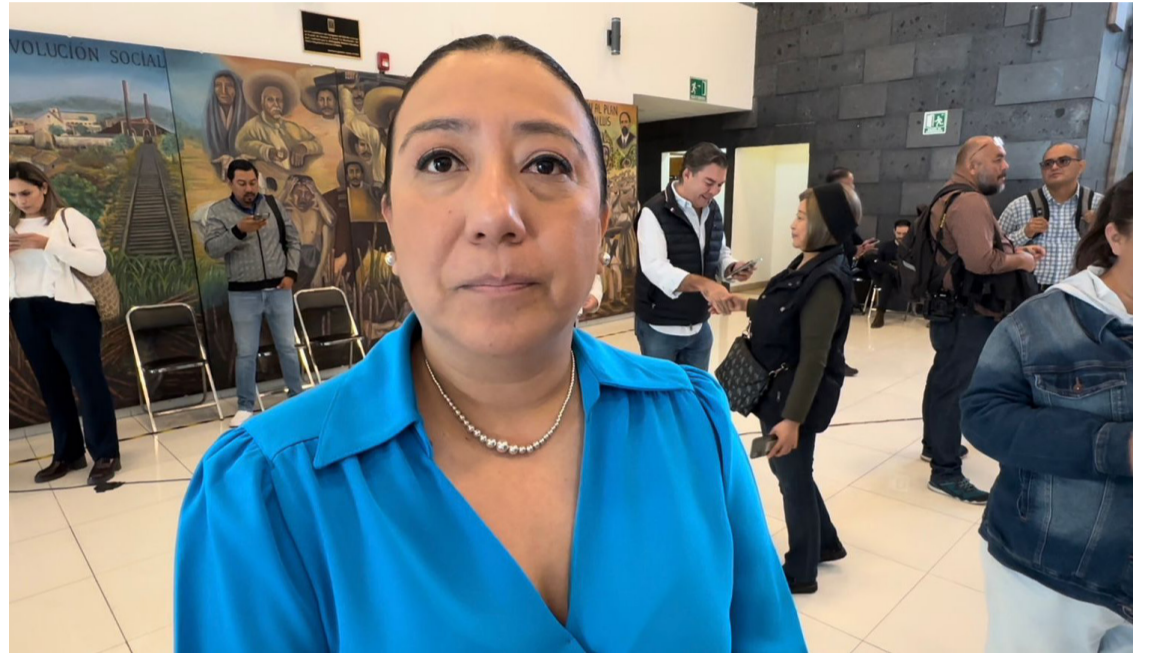
LA PRESIDENTA DEL Tribunal Unitario de Justicia para Adolescentes, Adriana Pineda, aseguró que las jubilaciones son un carga económica que se debe de atender en el próximo ejercicio fiscal, ya que el 20 por ciento del presupuesto se utiliza para este rubro.

pensiones, pues se va cargando al gasto operativo y eso merma que el tribunal pues pueda tener incluso recursos para temas de mantenimiento, por ejemplo”, concluyó Adriana Pineda.