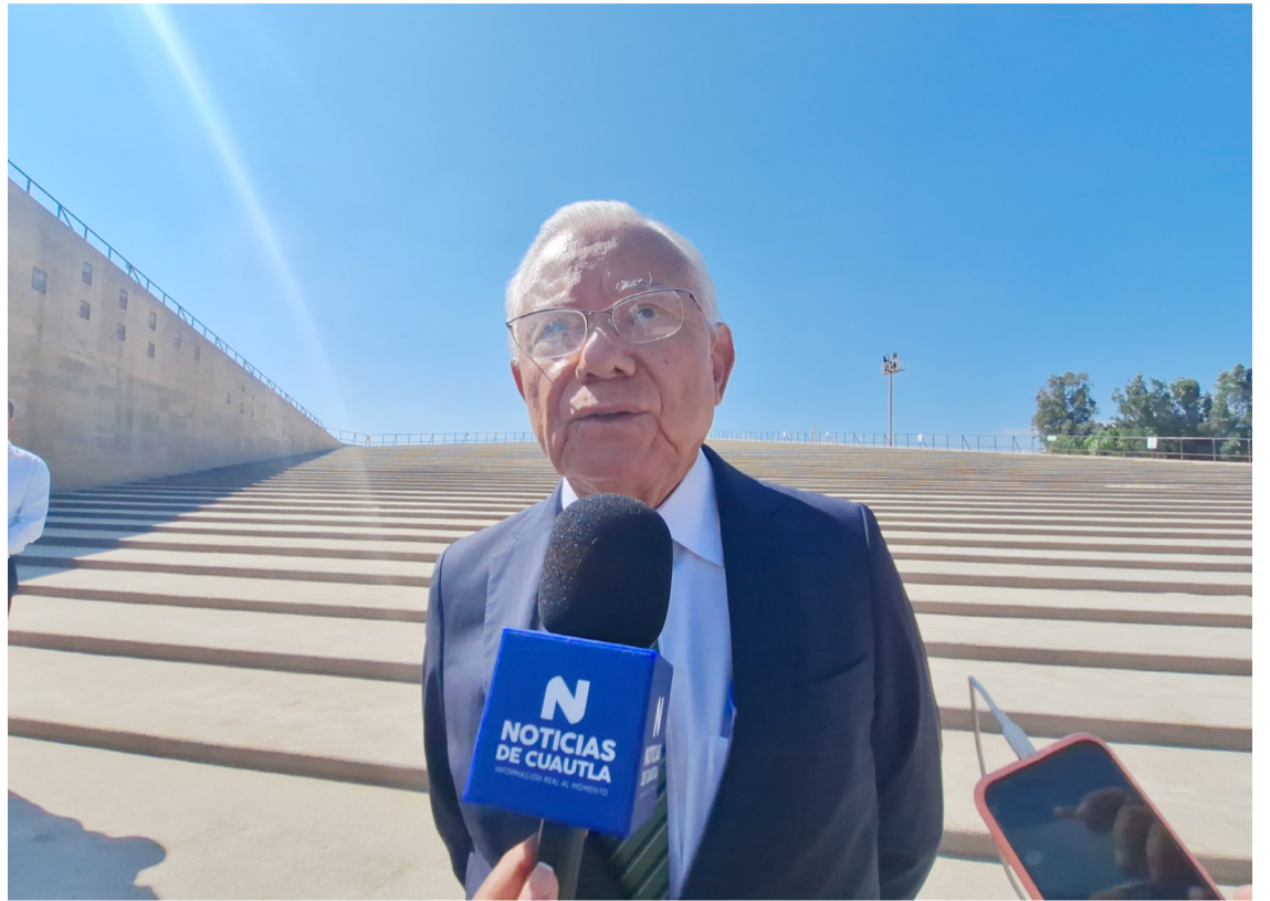
EL GOBIERNO DEL estado pidió a ediles electos valorar militares para ser secretarios de seguridad de sus municipios.

Pero el secretario de Gobierno, informó que en caso de no reunir los requisitos los integrantes de su terna, podrían ser militares retirados estar al frente de las corporaciones municipales.