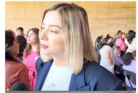
CASO FISCAL DE MORELOS GOBERNACIÓN No puede pasar desapercibido que en fecha 4 de septiembre de 2023, estando el Fiscal en la cárcel, el congreso local de Morelos aprobó en fast track una reforma para impedir la posibilidad que el fiscal fuera sustituido de manera permanente.