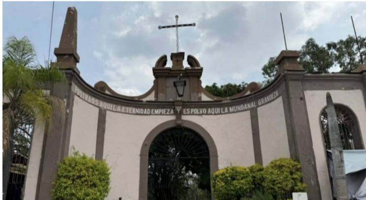
HASTA DOS CAMIONES de basura se recolectaron durante las jornadas de limpieza y descacharrización en los panteones de Morelos.

No obstante, la directora señaló que, se están realizando las gestiones necesarias para que, la feria de la Navidad se lleve a cabo en el mismo lugar donde cada años los comerciantes se instalan el primero de diciembre, sin embargo, señaló que, es compromiso del gobierno del estado el concluir con los trabajos de la remodelación para tener listo el primer andén del mercado.