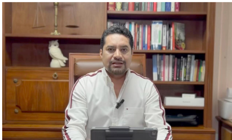
ABOGADOS DE MORELOS criticaron el mega puente vacacional por el Día de Muertos que se tomaron en el Tribunal Superior de Justicia y en Tribunal de Justicia Administrativa, ya que no eran días obligatorios además de que hay un rezago en la impartición de justicia.

dos sin excepción, están siendo altamente cuestionados por su falta de compromiso con la población, entonces si se está atravesando por una reforma judicial al Poder Judicial de la Federación, que en definitiva se tendrá que armonizar a las leyes locales, cómo es posible que el Pleno del Tribunal Superior de Justicia no entienda justamente que este tipo de acciones de corrupción, porque al final son actos de corrupción, dado que los días que se van de puente vacacional se les paga, es lo que se critica del Poder Judicial", concluyó Martínez Bello.