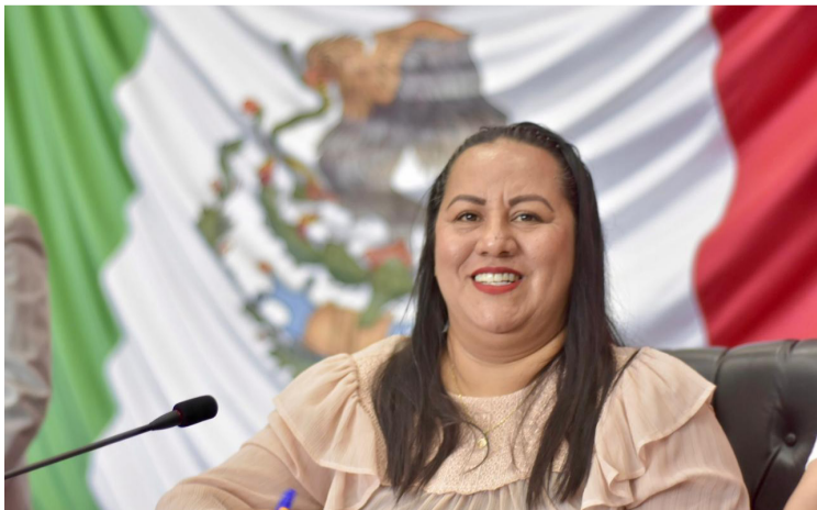
LA PRESIDENTA DE la mesa directiva del Congreso del Estado, Jazmín Solano, impulsará una iniciativa de ley destinada a agilizar el proceso de finiquitos para los trabajadores despedidos para prevenir la generación de laudos y deudas impagables.

La iniciativa será presentada formalmente en la próxima sesión del Congreso, donde se espera un amplio debate sobre su importancia y las implicaciones que tendrá para el futuro laboral en el estado.