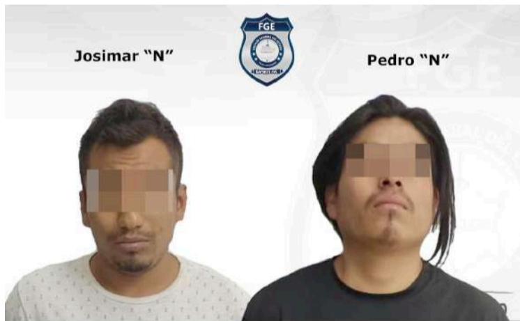
Se presumen inocentes, mientras no se declare su responsabilidad judicial. Art. 13 CNPP

Derivado de lo anterior, el automóvil quedó a disposición del Ministerio Público de la Fiscalía Regional Metropolitana para ampliar las investigaciones correspondientes.