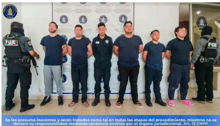
Se les presume inocentes y serán tratados como tal en todas las etapas del procedimiento, mientras no se declare su responsabilidad mediante sentencia emitida por el órgano jurisdiccional. Art. 13 CNPP.