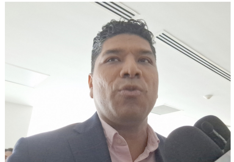
EL GOBIERNO DE MARGARITA González Saravia inició un recorrido para verificar el estado de la infraestructura hospitalaria de Morelos.