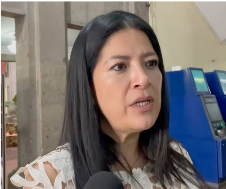
LA SECRETARÍA DE Hacienda del Gobierno del estado hará asignaciones presupuestales a las nuevas Secretarías y dependencias estatales.