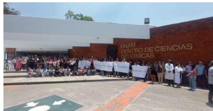
INVESTIGADORES DE MORELOS se sumaron al paro laboral de 24 horas contra los cambios en el Consejo Nacional de Ciencia y Tecnología (Conacyt).