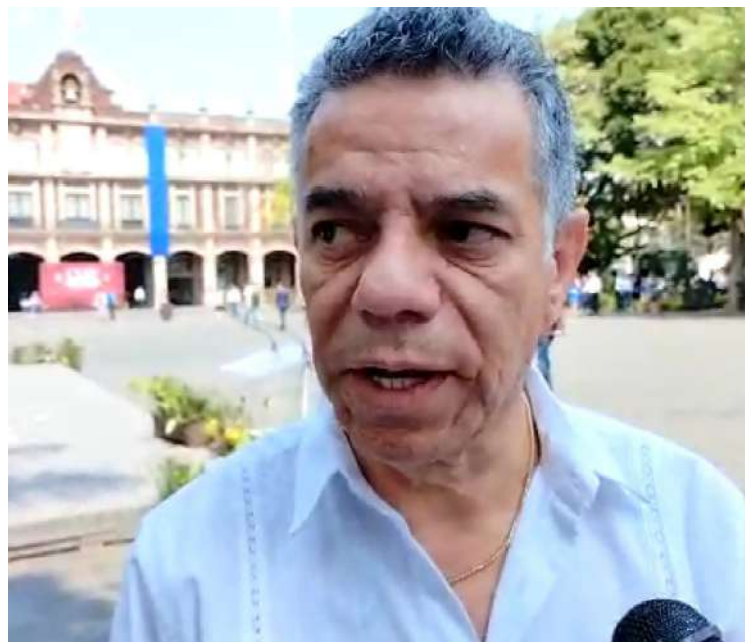
LA COMISIÓN ESTATAL del Agua logró mantener en operación 76 plantas tratadoras de aguas residuales a pesar de la falta de presupuesto para el ejercicio fiscal del 2023.

Juárez López concluyó, al recordar que en Morelos hay 141 plantas tratadoras de aguas residuales, de las cuales solo operan 76.