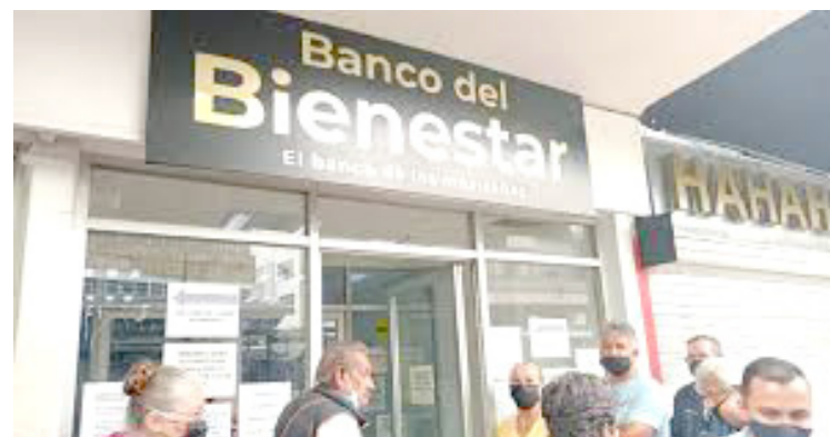
EN MORELOS la Secretaría de Bienestar Social detectó a ladrones de pensiones de adultos mayores, han detectado casos taxistas que asaltan a los pensionados afuera de la Secretaría de Bienestar en el norte de Cuernavaca.

Cabe mencionar, que la protesta provocó un intenso tráfico vehicular sobre la avenida Morelos y el primer cuadro de la ciudad de Cuernavaca durante aproximadamente dos horas.