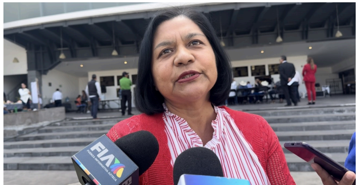
ANTE LA FALTA de oportunidades donde los jóvenes migran hacia Estados Unidos provocando una reducción significativa en las siembras agrícolas.

Ante la realidad, el presidente David López aseguró que, el actual gobierno del estado, está cumpliendo con una de las principales responsabilidades que no se ejercía en sexenios pasados, ejecutando acciones muy concretas, con estrategias mejor coordinadas entre el gobierno municipal y estatal, ya que, detalló que siempre existió una desunión y falta de comunicación entre ambos poderes.