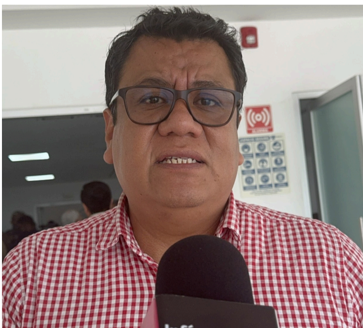
TRAS EL ABANDONO que ha sufrido el sector comercio durante el sexenio pasado, la Cámara Nacional de Comercio (Canaco) en Morelos, hizo un llamado al gobierno del Estado, para garantizar la seguridad durante las ventas más importantes del cierre de año.

Rafael Reyes aseguró que con la Comisión de Bienestar y Vivienda permitirá coordinar eficazmente los esfuerzos estatales para implementar los proyectos con transparencia y en beneficio de las familias, garantizando así que diferentes grupos de la sociedad puedan construir un futuro estable.