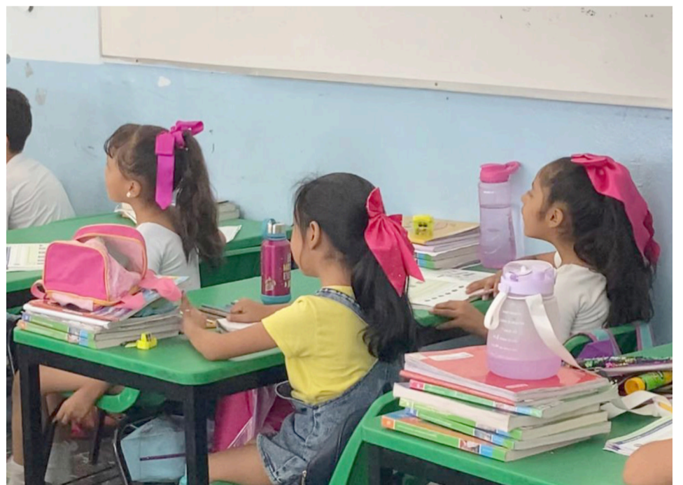
LA ASOCIACIÓN DE Padres de Familia solicitan a la Secretaría de Salud del gobierno del estado de Morelos, jornadas de vacunación en los planteles educativos de Morelos, para evitar enfermedades durante la temporada invernal.

Indicó que se requiere dar seguimiento a la vacunación de los niños y jóvenes, para que las unidades médicas o centros de salud, acudan a las instalaciones de las escuelas.