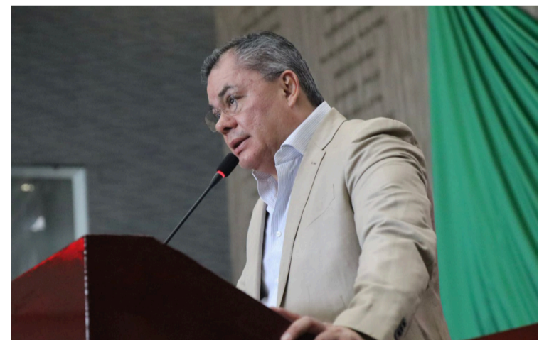
EL COORDINADOR DEL Grupo Parlamentario del partido político Morena en el Congreso del Estado de Morelos, Rafa Reyes propuso una iniciativa para reformar, adicionar y derogar diferentes disposiciones a la Ley Orgánica del Congreso del Estado de Morelos para crear la Comisión de Bienestar y Vivienda.