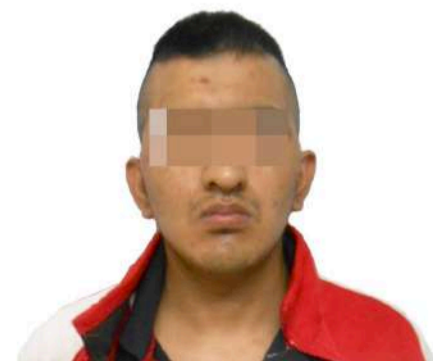
Se presume inocente, mientras no se declare su responsabilidad por autoridad judicial. Art. 13 CNPP