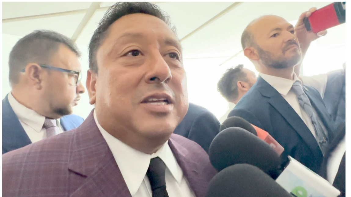
EL TITULAR DE la Fiscalía General de Morelos, Uriel Carmona Gándara, reconoció que se gastó el dinero que el Congreso local aprobó para la adquisición de un helicóptero.

Uriel Carmona concluyó, al mencionar también que las supuestas acusaciones de que no se les está pagando a los jubilados y pensionados de la dependencia, son falsas, ya que se está cumpliendo con estos pagos.