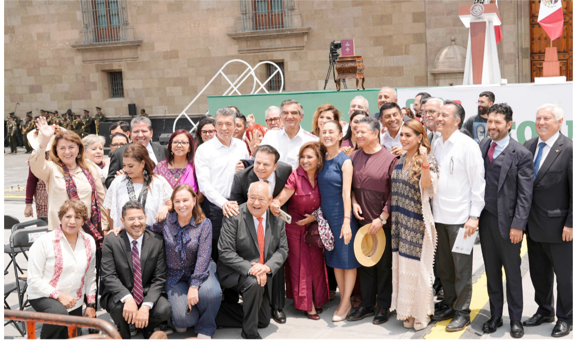
MARGARITA GONZÁLEZ SARAVIA , gobernadora electa del estado de Morelos, acudió este domingo al Zócalo de la Ciudad de México para acompañar al Presidente Andrés Manuel López Obrador en su sexto Informe de Gobierno.