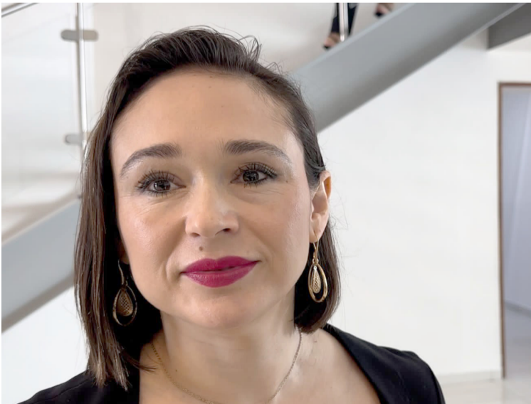
EL TRIBUNAL ELECTORAL del Estado de Morelos resolvió este fin de semana más impugnaciones en contra de los resultados de la elección de presidentes municipales y designación de regidores sin registrar cambios importantes, solo faltan ocho localidades.

Finalmente, dijo que desde los Servicios de Salud se realizan operativos contra el dengue, zika y chikungunya en los municipios para eliminar criaderos de mosquitos.