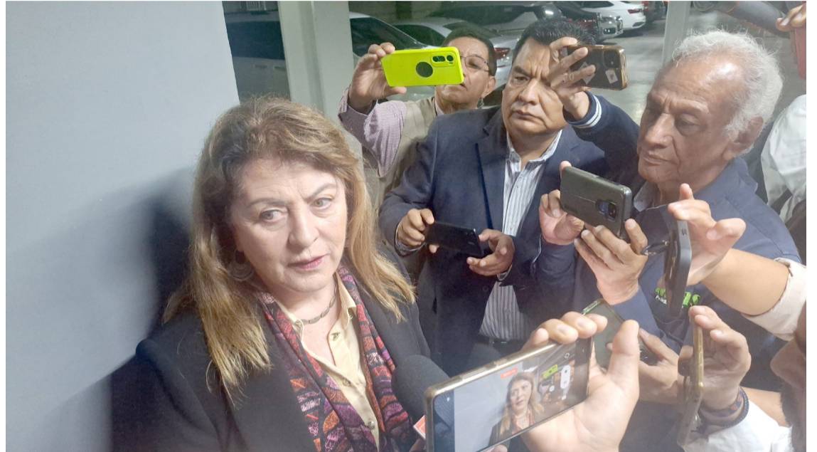
LA GOBERNADORA ELECTA Margarita González Saravia dijo que privilegiará el diálogo con el Congreso del estado.

González Saravia dijo que avanzará en temas importantes con la actual legislatura y que planteará a futuro diversas iniciativas.