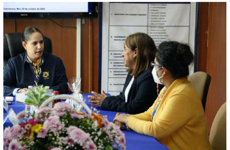
EL COLEGIO DE BACHILLERES del Estado de Morelos (Cobaem) y el Centro de Estudios Universitarios International House (IH) celebraron la firma de convenio de colaboración con el fin de ofrecer a los estudiantes de bachillerato un camino exitoso hacia la Educación Superior en la enseñanza del inglés.

Durante la firma, ambas instituciones acordaron establecer nuevas estrategias para la impartición de las clases en la lengua náhuatl, usando las mejores prácticas y experiencias que impacten en el proceso de enseñanza-aprendizaje de las y los jóvenes Educación Media Superior.