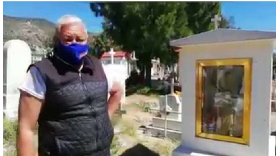
MILES DE FAMILIAS acudieron este martes 1 de noviembre a visitar a sus seres queridos a los diferentes panteones de Morelos con motivo del Día de Muertos.

Cabe mencionar, que como esta familia muchas más decidieron acudir a los panteones durante este Día de Muertos, algunos incluso arribaron desde otros estado de la República como Guerrero, Estado de México y Puebla.