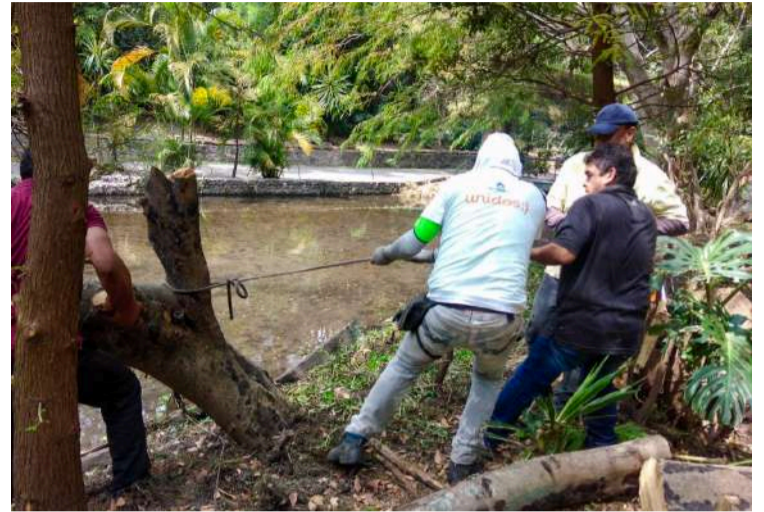
COMO PARTE de las medidas preventivas en materia de protección civil que se realizan en el Parque Barranca de Chapultepec de Cuernavaca, personal de esta Área Natural Protegida (ANP) trabajó en la poda de árboles y el retiro de otros más que estaban secos, esto para preservar la seguridad de los visitantes y colaboradores.