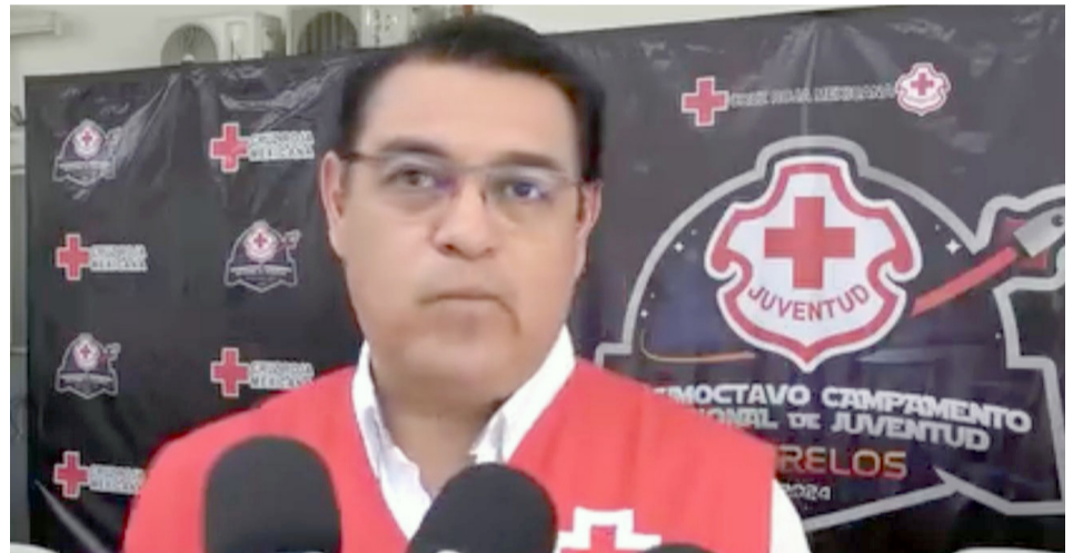
LA CRUZ ROJA Mexicana en Morelos hizo un llamado a los presidentes municipales para continuar apoyando a la Cruz Roja a través de convenios de colaboración.

La parte fundamental que sostenía la unión entre los comerciantes del Mercado Adolfo López Mateos, se fracturó con el asesinato de mil vicepresidente de la Unión de Introdutores.