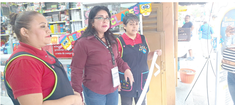
LA PROCURADURÍA FEDERAL del Consumidor (Profeco) delegación Morelos advirtió a los padres de familia sobre el riesgo de comprar los útiles escolares en el comercio ambulante.

Sin embargo, pidió a los papás estar atentos y comparar precios, además, denunciar cualquier abuso por parte de los negocios.