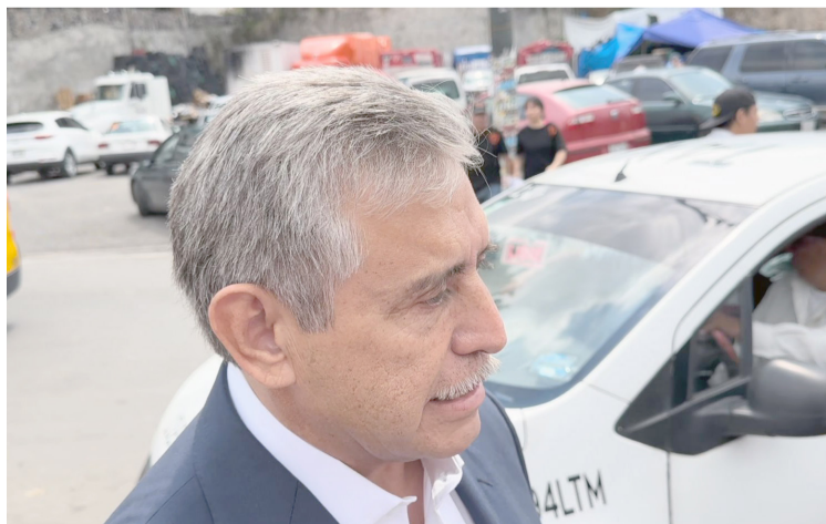
A PESAR DE que aún no se define quién será el nuevo titular de la Comisión Estatal de Seguridad Pública durante la administración de Margarita González Saravia, el Ayuntamiento de Cuernavaca se sumará a las acciones que se implementen.

Una vez que son tratadas las aguas, estas se recolectan periódicamente y enviadas a laboratorios certificados, para constatar el agua tratada en base a la norma oficial.