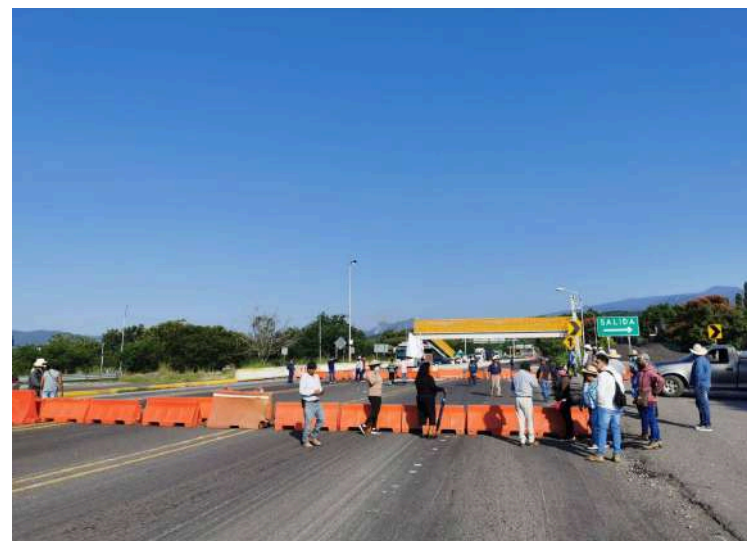
EJIDATARIOS DE LOS MUNICIPIOS de Tlayacapan, Yauatepec y Tepoztlán cerraron las 2 vialidades de norte a sur y de sur a norte de la autopista La Pera-Cuautla, lo que ya provocó un severo caos vial sobre la caseta de cobro de Oacalco, municipio de Yauatepec.

Dejaron en claro que ya están cansado de promesas que no se quieren cumplir, entonces lo que van a hacer es que si no llegan se van a mantener en el plantón, todo el tiempo que sea posible, “hasta que vengan a hablar con nosotros, entendemos que hay afectaciones, pero, no nos quieren hacer caso ni oír”.