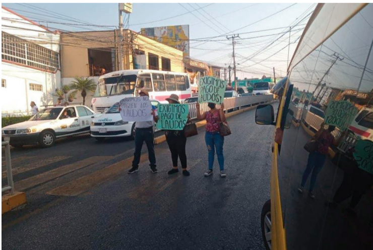
EX TRABAJADORES DEL Ayuntamiento de Temixco se manifestaron la mañana de este viernes para exigir el pago de laudos, los cuales se les deben desde la pasada administración.