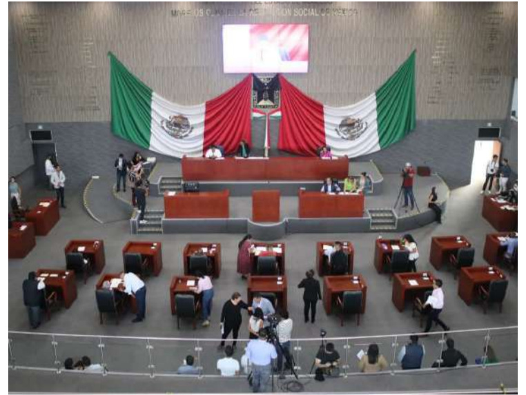
PRESENTÓ MC una iniciativa para crear la Ley de Voluntad Anticipada en materia de Salud para las personas en caso de contingencia o de enfermedad terminal del Estado de Morelos.

ese derecho y no resulte oneroso para los mismos, siendo que solamente tendrían que cubrir el costo de las copias certificadas de dicha comparecencia para llevarlas a la coordinación especializada.