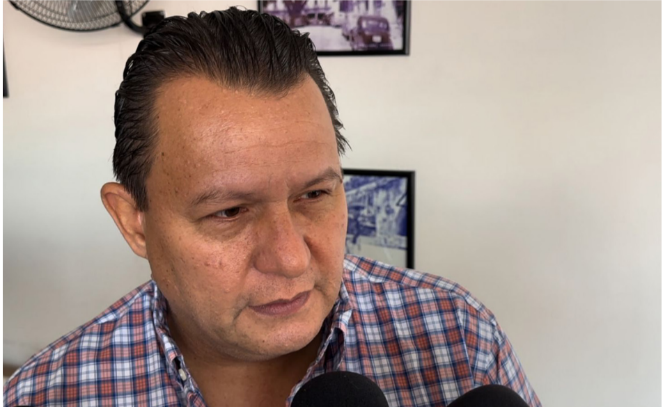
RESTAURANTEROS DE MORELOS reportan una baja afluencia de comensales durante esta temporada de vacaciones debido a los gastos del regreso a clases.

los restauranteros esperaban un aumento superior al 20 por ciento durante estas vacaciones, pero en establecimientos ubicados en sitios turísticos el incremento que se preveía era mayor.