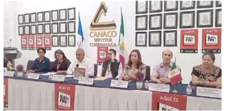
ESTE PRÓXIMO viernes iniciará la campaña de descuentos de El Buen Fin, por lo que comerciantes de Morelos esperan un importante aumento en sus ventas que impulsará la economía del país y de la entidad.

López Laguardia concluyó, al mencionar que se contará con el apoyo de las autoridades policíacas estatales y municipales para garantizar la paz y seguridad, con el fin de que los ciudadanos puedan acudir a realizar sus compras sin ningún problema.