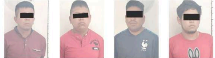
Jesús Ángel "N" Misael "N" Samuel "N" Jair "N"

Coordinación Estatal para la Construcción de la Paz